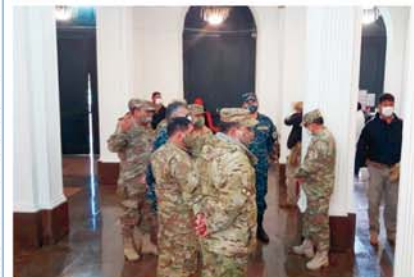
ALTOS JEFES MILITARES SE PRESENTARON EN LA ASAMBLEA POR EL TEMA DE ASCENSOS.