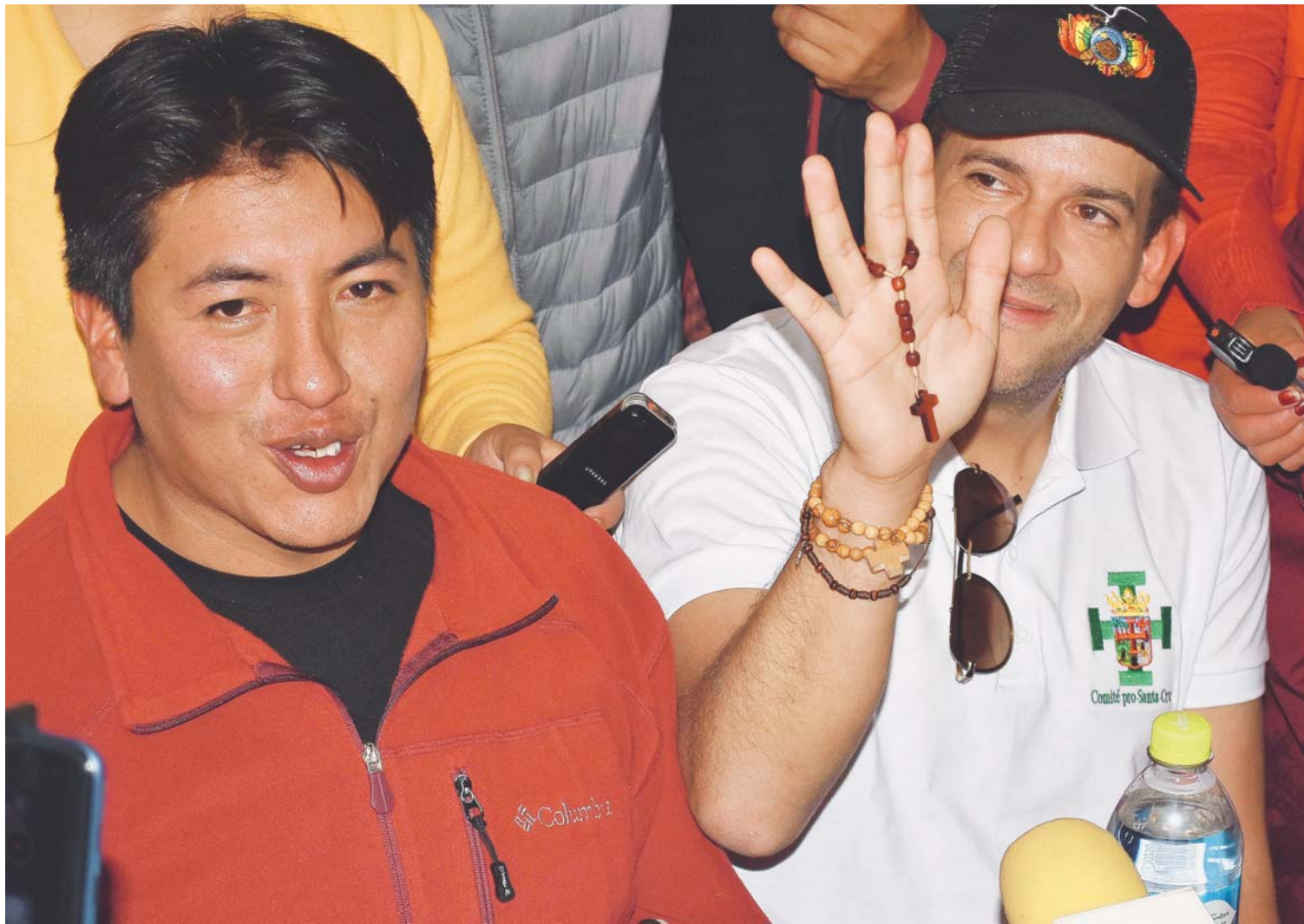
CÍVICOS DE POTOSÍ Y SANTA CRUZ QUE ESTUVIERON A LA VANGUARDIA DE LAS MOVILIZACIONES DE LA RESISTENCIA, CON EL OBJETIVO DE RECUPERAR LA DEMOCRACIA PARA BOLIVIA.

> El líder cruceño resaltó que “la población ya está cansada de los actores tradicionales de la política y que se requiere renovar los próximos hombres y mujeres que conducirán el destino del país”