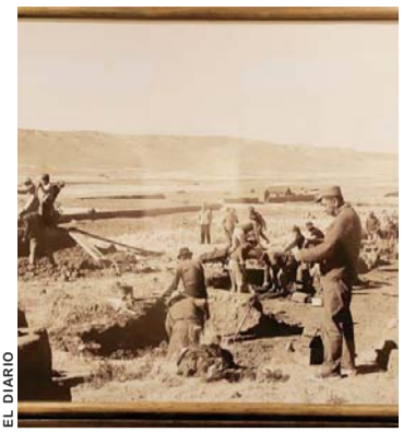
EXPOSICIÓN DE FOTOGRAFÍAS MUESTRA QUE LAS RUINAS DE TIWANAKU FUERON MODIFICADAS.

En horas de la noche de ayer, la Asamblea de la Cruceñidad, en la que estaban presentes los diferentes sectores sociales, cívicos, del sector gremial y autotransporte determinaron que se apruebe la declaratoria de desastre nacional por los incendios en la Chiquitania, convocar a cabildo y suspender los festejos del 24 de septiembre por el aniversario de ese departamento.