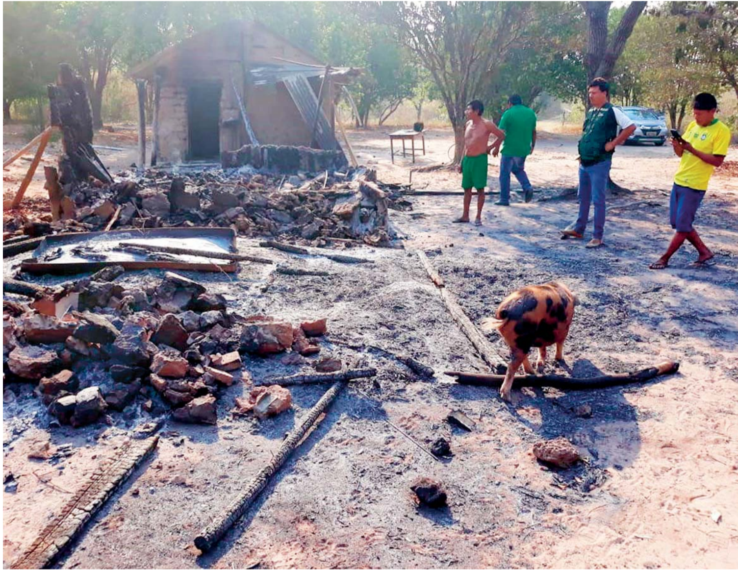
EL FUEGO SE DESCONTROLÓ DURANTE LA JORNADA DE AYER, DEJANDO UN SALDO DE 10 CASAS QUEMADAS EN EL MUNICIPIO DE SAN MATÍAS, POR LO QUE SUMAN LA VOCES QUE EXIGEN AL GOBIERNO LA DECLARATORIA DE DESASTRE NACIONAL ANTE LA MAGNITUD DE INCENDIO EN LA CHIQUITANIA.

> Las comunidades de Candelaria y Minador, del municipio de San Matías, fueron afectadas por el avance de fuego incontrolable. El Alcalde de Roboré sostiene que los esfuerzos ya fueron rebasados > Asamblea de la Cruceñidad exige al Gobierno la declaratoria de desastre nacional, después de casi dos meses de fuego en Chiquitania y el vicepresidente Álvaro García afirma que "una palabra no nos va a salvar"