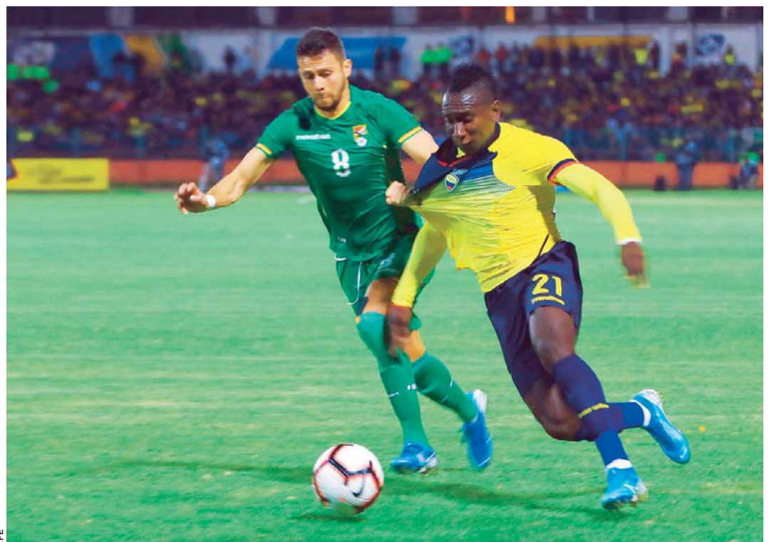
INCIDENCIAS DEL COTEJO JUGADO AYER ENTRE ECUADOR Y BOLIVIA EN CUENCA.

Ambas escuadras se encuentran en un proceso de renovación de sus respectivas plantillas de cara al clasificatorio sudamericano al Mundial Qatar-2022.