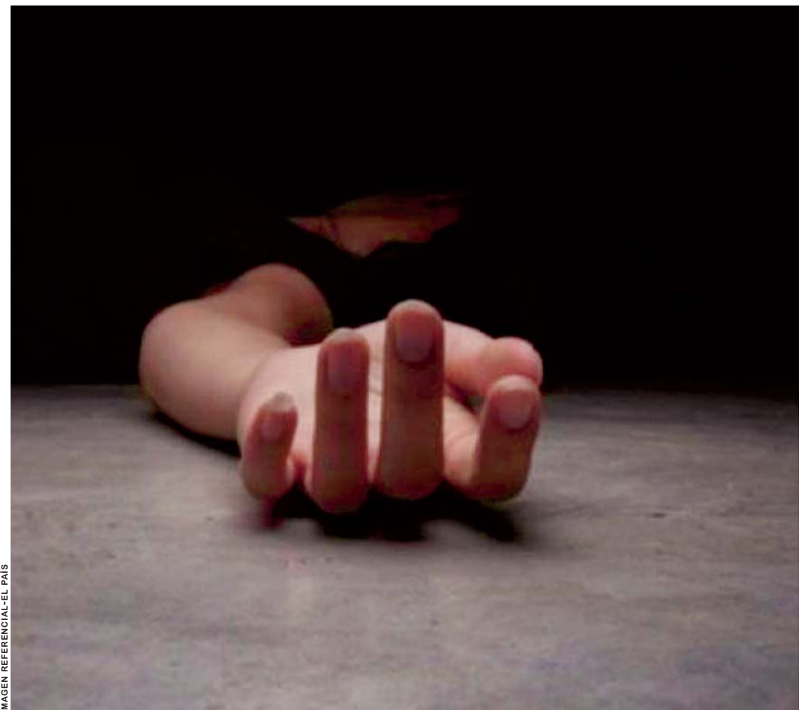
LA MUERTE DE MUJERES EN MANOS DE SUS PAREJAS VA EN AUMENTO EN BOLIVIA.

Durante la reciente Cumbre de Seguridad Ciudadana, la autoridad lamentó las vergonzosas cifras que Bolivia debe enfrentar por la escalada de la violencia contra las mujeres.