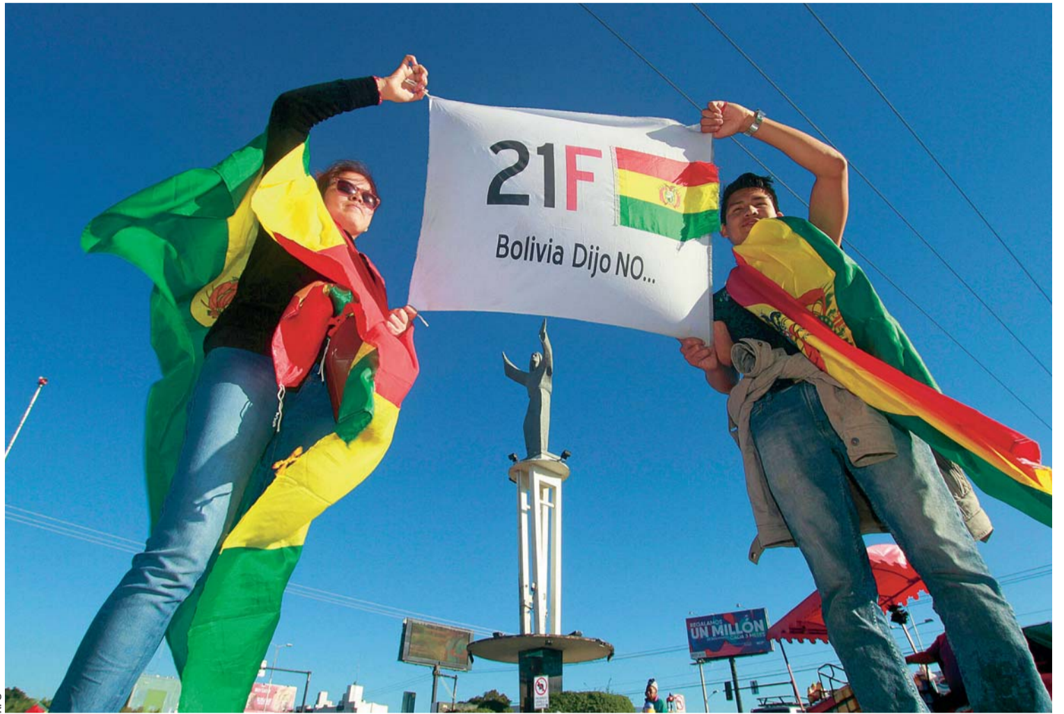
PARO DE ACTIVIDADES EN SANTA CRUZ FUE CONTUNDENTE, SEGÚN CÍVICOS QUE AHORA PREPARAN LA MEDIDA A NIVEL NACIONAL.

> Para el Gobierno, la medida de presión efectuada en Santa Cruz solo perjudicó el desarrollo económico de esa región > En la capital oriental, las principales calles permanecieron cerradas, los vecinos de las diferentes zonas colocaron obstáculos en las vías