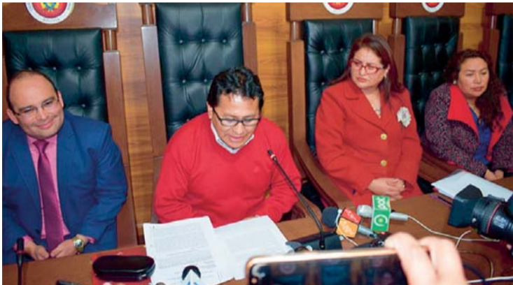
TRIBUNAL CONSTITUCIONAL PLURINACIONAL.