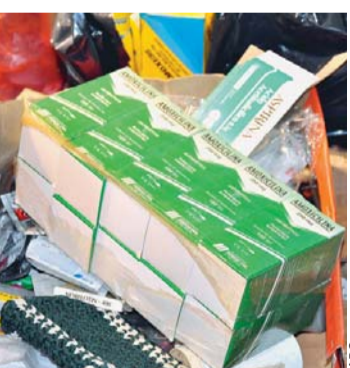
MEDICAMENTOS FALSOS QUE SE COMERCIALIZABAN EN LA PAZ.