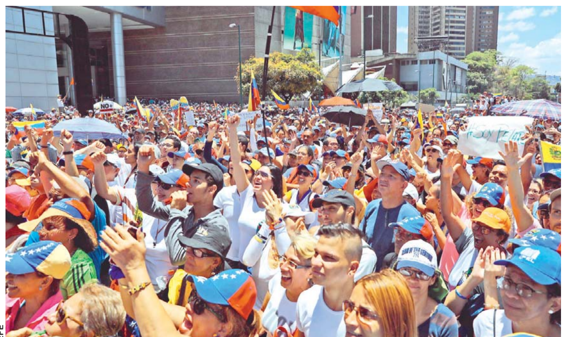
MILES DE OPOSITORES VENEZOLANOS TOMARON AYER LAS CALLES DE CARACAS PARA PROTESTAR CONTRA EL GOBIERNO DEL PRESIDENTE NICOLÁS MADURO.

Guaidó, quien se proclamó presidente interino del país en enero pasado, convocó a sus simpatizantes a concentrarse en 358 puntos del territorio venezolano como parte del "inicio" de la llamada "Operación Libertad" una fórmula con la que espera lograr el "cese de la usurpación" que considera hace Maduro de la Presidencia.