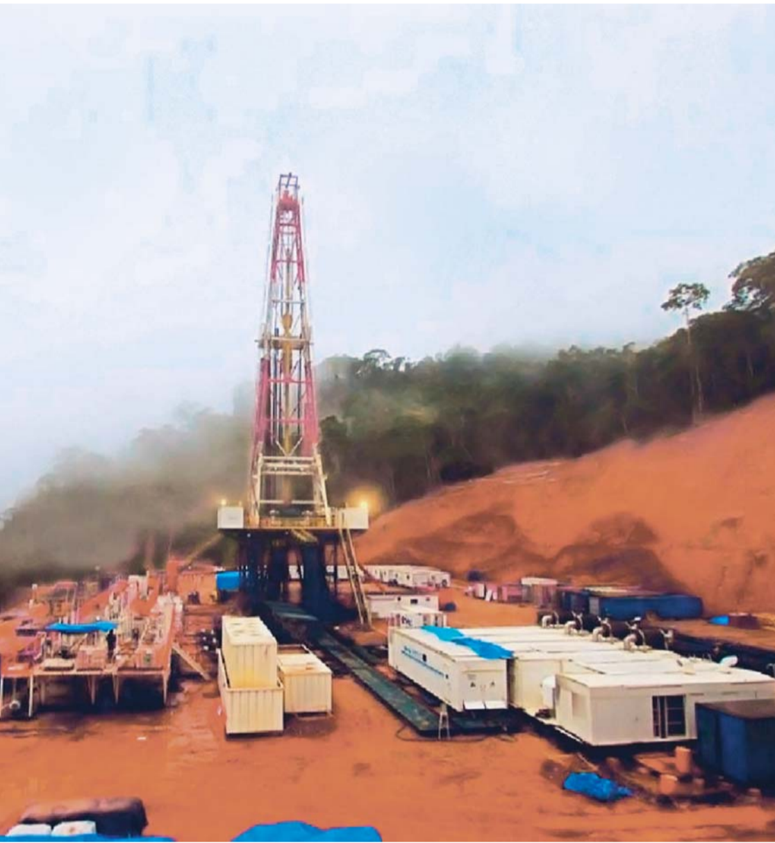
INTERVENCIÓN EN ÁREA PROTEGIDA PARA LA EXPLORACIÓN DE HIDROCARBUROS.