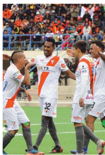
FESTEJO DE LOS JUGADORES DE ALWAYS READY DESPUÉS DE MARCAR UN GOL.