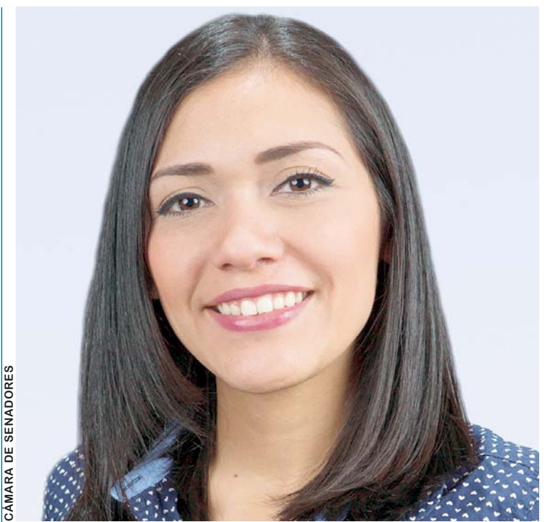
ADRIANA SALVATIERRA, PRESIDENTA DEL SENADO DE BOLIVIA.

"Sin embargo, continuará colaborando y trabajando con los países del GIC y de la Unión Europea, en todo aquello que se encuentre a su alcance para coadyuvar a la estabilidad en Venezuela", completó el anuncio de la Cancillería.