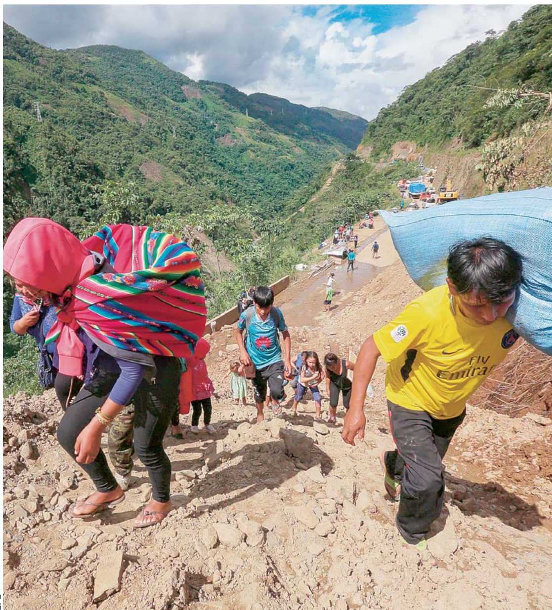
POBLADORES PASAN POR EL LUGAR DEL DESLIZAMIENTO EN LA CARRETERA QUE UNE A LA SEDE DE GOBIERNO CON LA POBLACIÓN DE CARANAVI, DONDE SE REALIZAN LOS TRABAJOS DE ESTABILIZACIÓN, EN PUENTE ARMAS.

Asimismo, el Club JRR Tolkien Bolivia organiza una maratón de 10 horas con las tres películas de la saga de El Hobbit (en idioma original) el 9 de febrero (sábado) en el Cine Teatro 6 de Agosto. El ingreso es un donativo voluntario de material escolar o víveres que irán en beneficio de los damnificados por los desastres naturales.