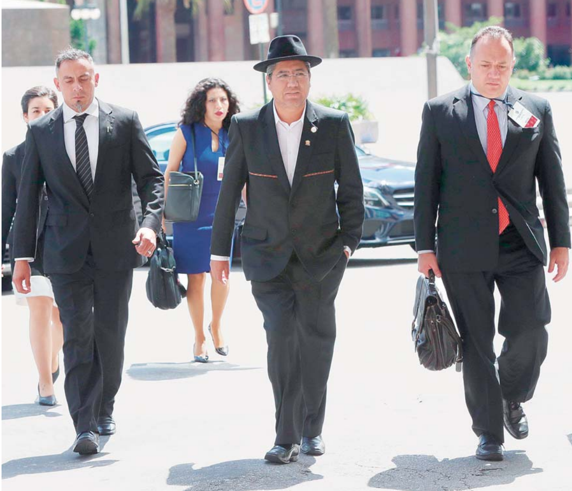
EL CANCELLER DIEGO PARY ARRIBANDO A LA PRIMERA REUNIÓN DEL GRUPO INTERNACIONAL DE CONTACTO SOBRE VENEZUELA, FUE AYER, EN MONTEVIDEO (URUGUAY).

> En semanas pasadas, la Unión Europea convocó a Francia, Alemania, Italia, España, Portugal, Suecia, Holanda y Reino Unido, así como Ecuador, Costa Rica, Uruguay y Bolivia, para plantear "un proceso democrático creíble" en el vecino país