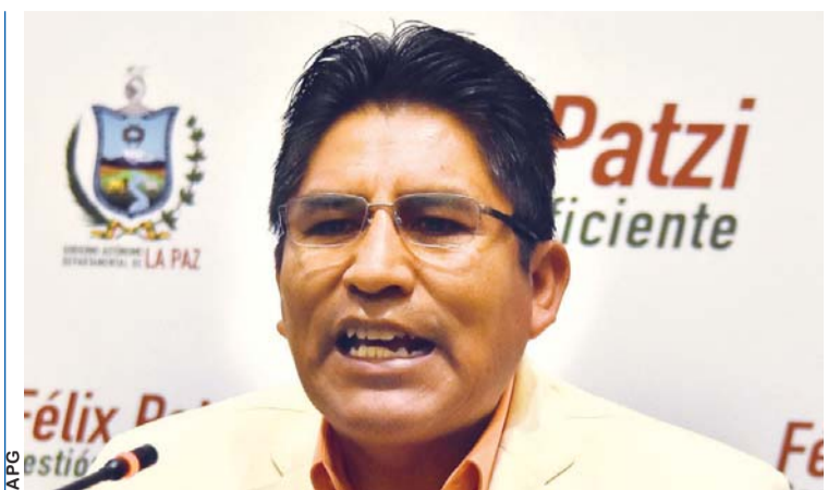
GOBERNADOR DE LA PAZ, FÉLIX PATZI, ESTUVO AUSENTE CUANDO CARANAVI LO NECESITÓ.

"A mis hermanos presidentes de América Latina y el Caribe les hago un llamado para que juntos evitemos que la violencia se desate en Venezuela. Respaldemos el diálogo. Aprendamos de la historia y recordemos lo difícil que es desandar el camino de la guerra y la confrontación", escribió en su cuenta de Twitter.