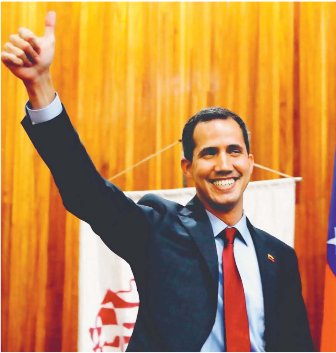
CADA DÍA SUMA APOYO A JUAN GUAIDÓ, COMO PRESIDENTE ENCARGADO DE VENEZUELA.

exvicepresidente, Víctor Hugo Cárdenas, y los líderes políticos Samuel Doria Medina y Óscar Ortiz suscribieron el documento que sostiene que el reconocimiento se realiza en el marco de la Constitución Política del Estado de esa nación, "con el objetivo de llevar adelante el restablecimiento del orden constitucional y democrático, para convocar a elecciones presidenciales libres".