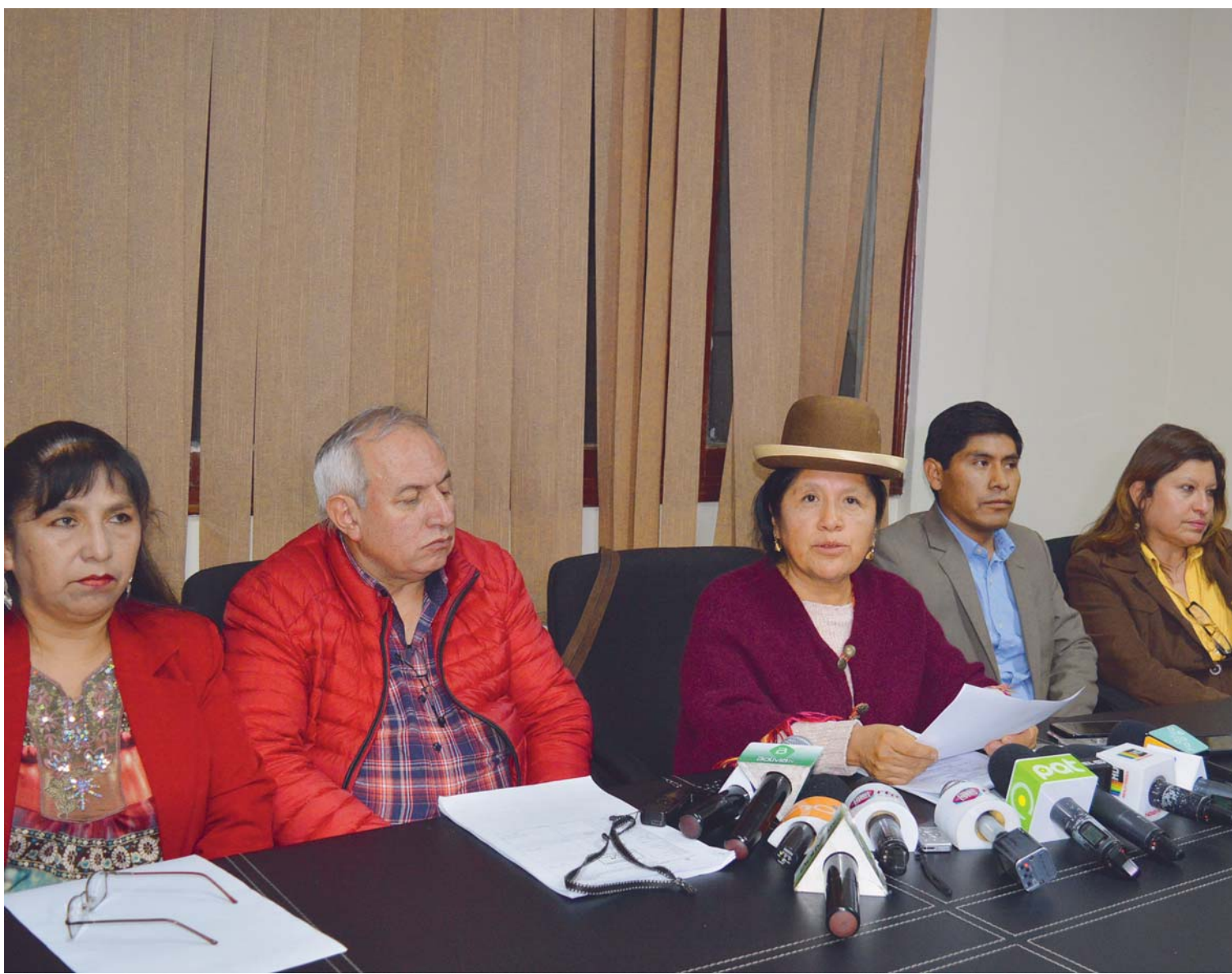
VOCALES DEL TRIBUNAL SUPREMO ELECTORAL QUE APROBARON LA REPOSTULACIÓN DE EVO MORALES Y SOBRE LOS CUALES AHORA SE AHONDÓ LA DESCONFIANZA DE OPOSITORES Y ACTIVISTAS.