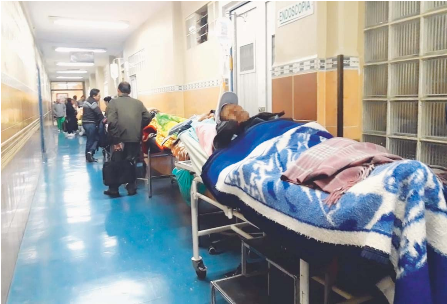
ATENCIÓN DE ENFERMOS EN LOS PASILLOS. DRAMÁTICA SITUACIÓN DE HOSPITALES PÚBLICOS.

> "En el marco del Sistema Único de Salud (SUS) las gobernaciones podrán entregar la administración de los hospitales de tercer nivel al Gobierno central, y así en un mes ya no habrá pacientes que sean atendidos en los pasillos", dijo la autoridad > Para el diputado opositor Rodrigo Valdivia, "el Gobierno ya no tiene nada que ofrecer al pueblo boliviano y ahora recurre a la demagogia"