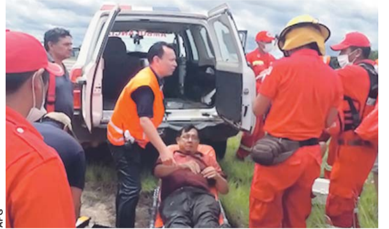
HERIDO ES AUXILIADO LUEGO QUE UNA AVIONETA SE PRECIPITARA EN BENI.

El piloto de la avioneta sufrió politcontusiones y fue trasladado al hospital "Jorge Henrich", mientras que los tres pasajeros que iban a bordo salieron ilesos.