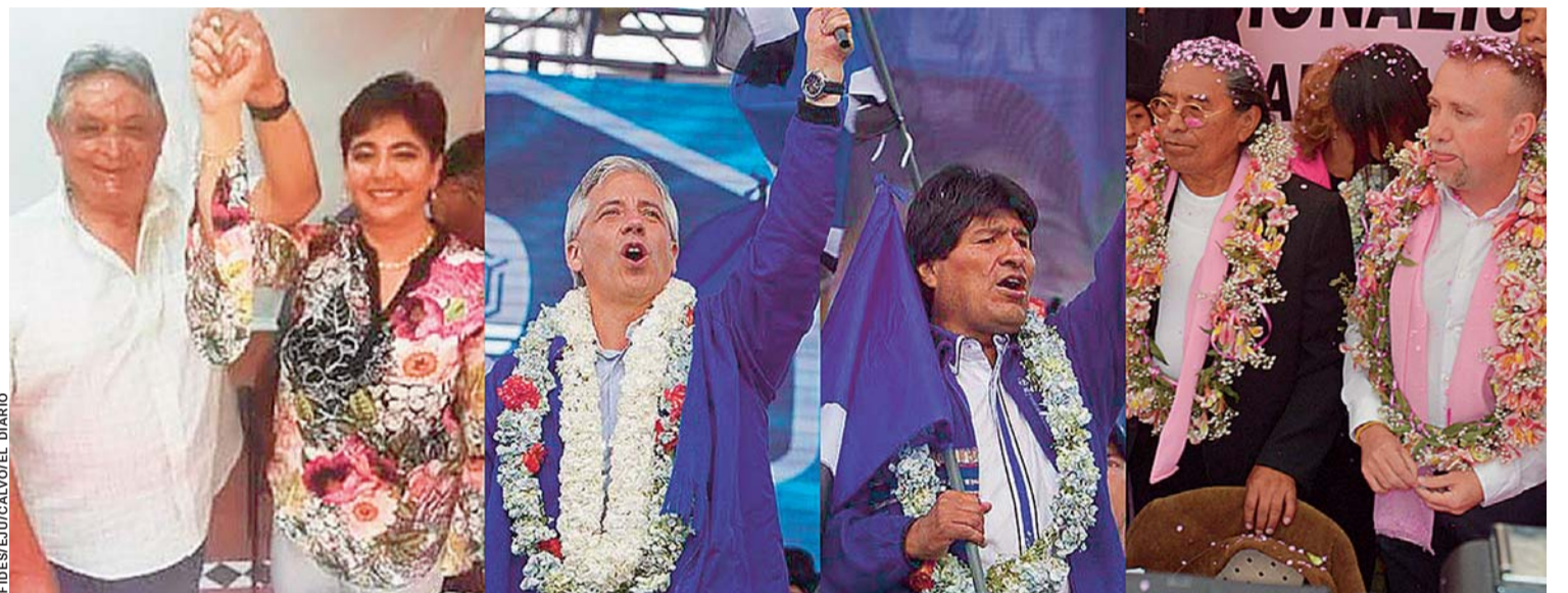
BINOMIOS IDENTIFICADOS A SÓLO UN DÍA DE LA FINALIZACIÓN DE PLAZO PARA LA PRESENTACIÓN ANTE EL TSE.