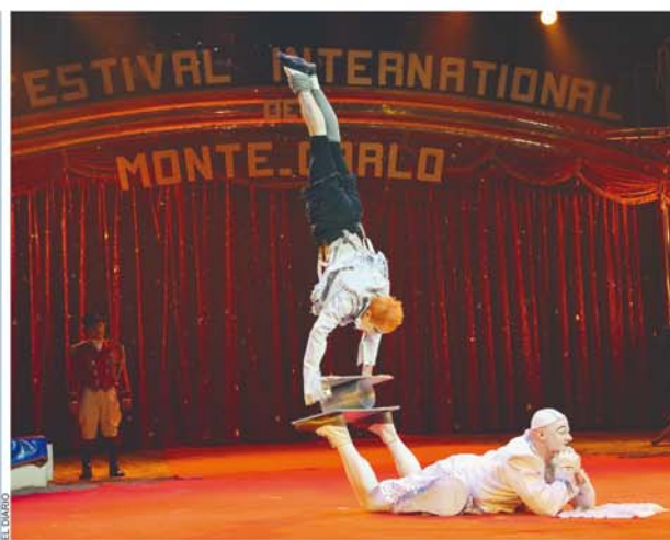
ESPECTACULAR CIRCO RUSO VUELVE A BOLIVIA. ESTA ESCUELA TIENE MÁS DE 300 AÑOS DE TRADICIÓN.