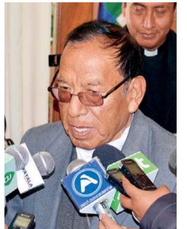
CARDENAL TORIBIO TICONA

Un api morado caliente y un pastel frito con queso fue el desayuno que compartieron ayer el presidente Evo Morales, el cardenal Toribio Ticona y los representantes de la Conferencia Episcopal Boliviana, en reunión que sirvió para un acercamiento Gobierno - Iglesia y en el que el mandatario anunció que acompañará a la nueva autoridad eclesial en su consagración cardenalicia programada para el 29 de junio en el Vaticano.