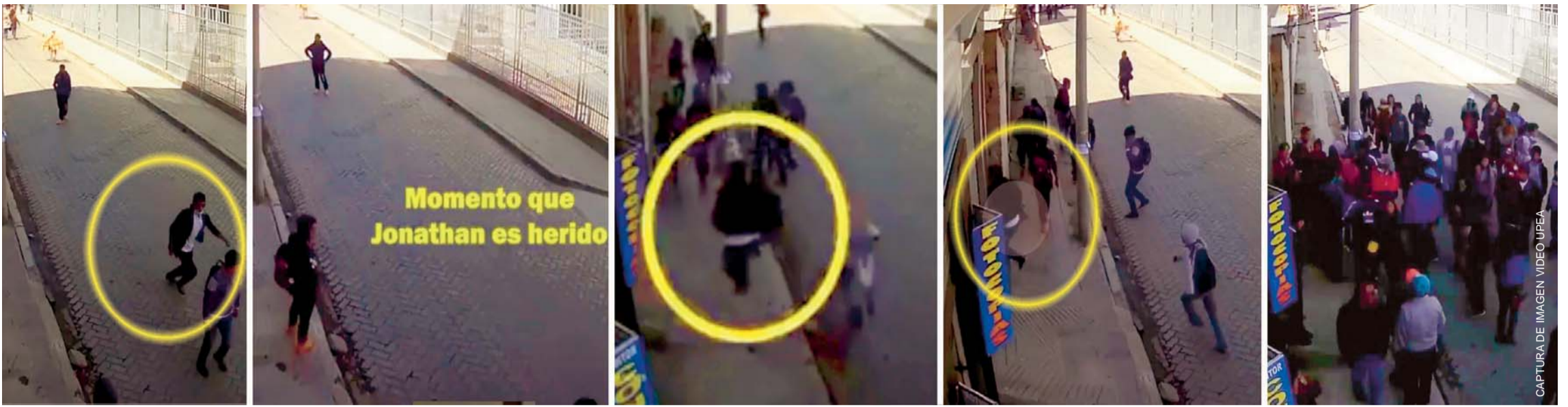
SECUENCIA MUESTRA LOS ÚLTIMOS MOMENTOS DE LA VIDA DE JONATHAN, CAPTADOS POR LAS CÁMARAS DE SEGURIDAD DE LA CALLE.

Universidades protestaron en todo el país y otra vez hubo represión