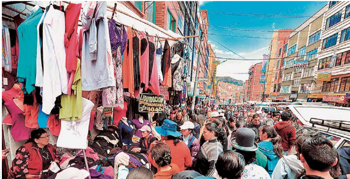
CALLE TUMUSLA DE LA PAZ, UNA DE LAS MÁS CONCURRIDAS POR LOS POBLADORES DEL ÁREA URBANA.