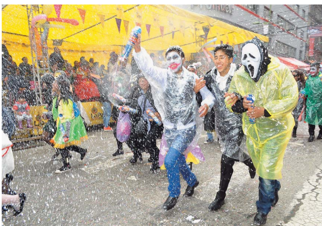
JUVENTUD QUE DIO RIENDA SUELTA A SU ENTUSIASMO EN DOMINGO DE CARNAVAL.