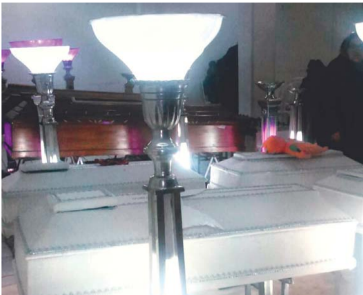
VELATORIO DE LAS VÍCTIMAS DE LA TRAGEDIA EN ORURO Y VISITA DE AUTORIDADES EDILES A HERIDOS.

• Comerciantes aseguran que se trata de un atentado perpetrado por dos personas, aparentemente mineros, resentidos y ebrios que activaron el explosivo. Liberan de culpa a la vendedora de chicharrón y exigen a la Policía ahondar en la investigación para llegar a la verdad