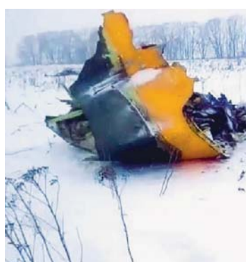
RESTOS DE LA NAVE DESPUÉS DEL SINIESTRO.

Un avión birreactor de pasajeros AN-148 con 71 personas a bordo se estrelló ayer en las