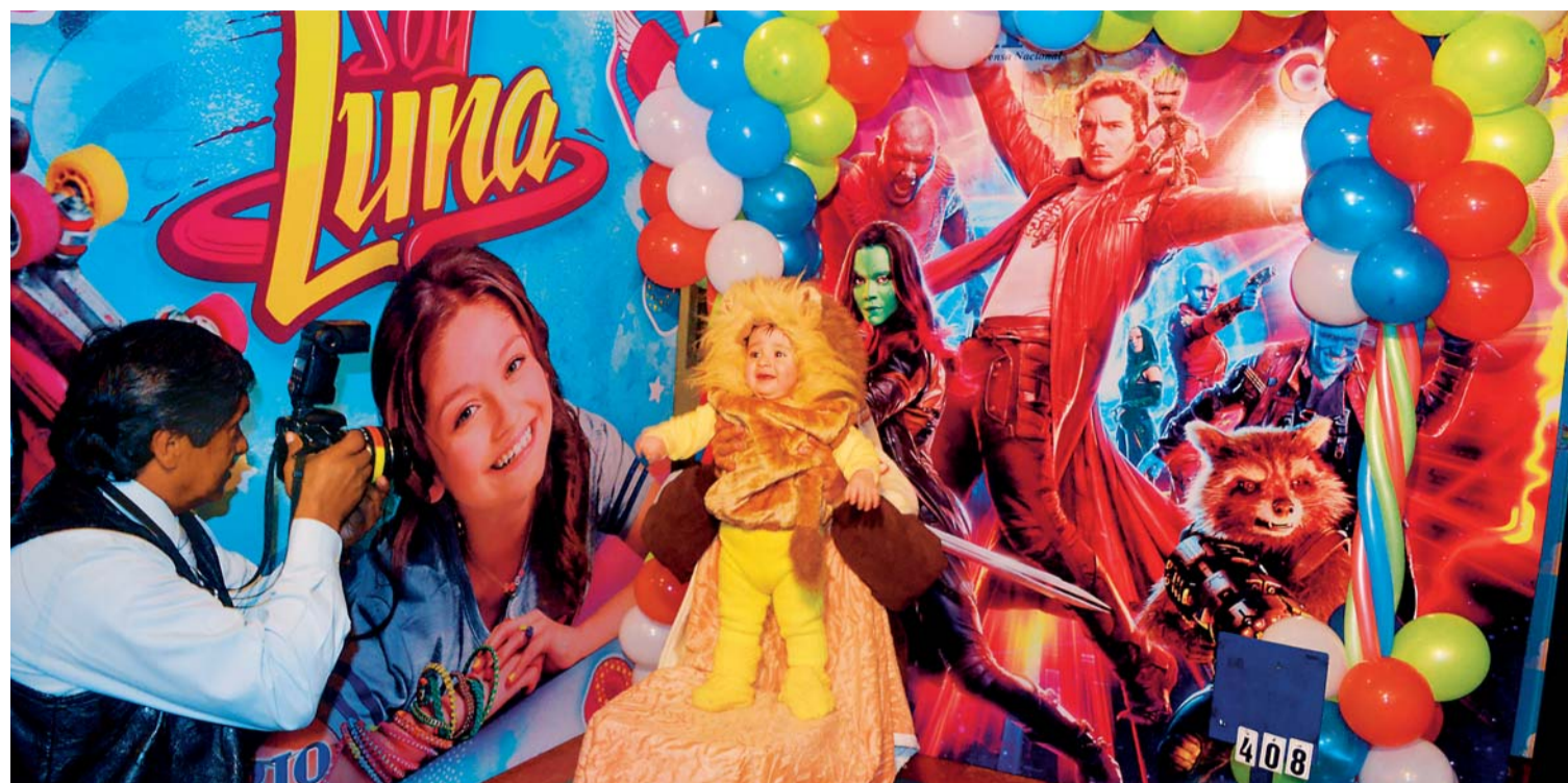
EL DIARIO ABRE SUS PUERTAS A LOS ENTUSIASTAS NIÑOS DISFRAZADOS Y SUS FAMILIAS, QUE PARTICIPARÁN EN EL CORSO INFANTIL Y QUE QUIEREN INMORTALIZAR SU DISFRAZ A TRAVÉS DE UNA FOTOGRAFÍA.

El citado autor es considerado "el último de los representantes de la generación paceña posromántica" y "un gran impulsador de la instrucción pública". El 14 de febrero de 1879, se produjo la injusta e indigna invasión militar chilena al puerto de Antofagasta, que dio inicio a la Guerra del Pacífico.