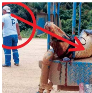
IMAGEN QUE CONMUEVE POR LA CRUELDAD CON LA QUE EXTRANJEROS EXTERMINAN NUESTRA FAUNA.