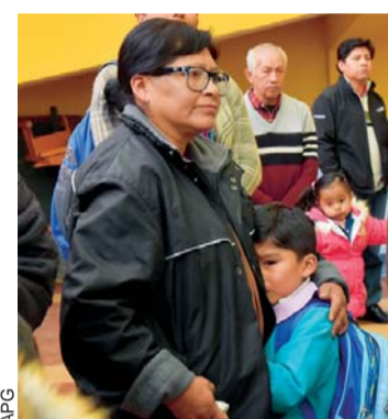
CUESTA SEPARARSE DE LA MADRE CUANDO ES LA PRIMERA VEZ QUE VAMOS A LA ESCUELA.