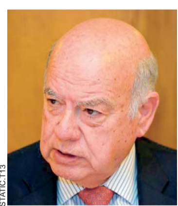
JOSÉ MIGUEL INSULZA

"Esas palabras son alentadoras porque están rescatando una visión a futuro. Lo veo con mucha expectativa y esperan-