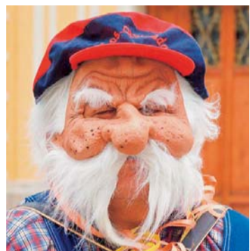
LOS OLVIDADOS, TRADICIÓN PACEÑA DEL CARNAVAL.

Bajo el lema "Viva el carnaval en democracia y no hagamos de la democracia un carnaval", el Movimiento Cultural Los Olvidados ofrecerá dos recitales, entre hoy y mañana, con un repertorio que incluye temas propios del Carnaval Paceño de antaño. La cita es en el Teatro Municipal Alberto Saavedra Pérez, a partir de las 19.30 horas.