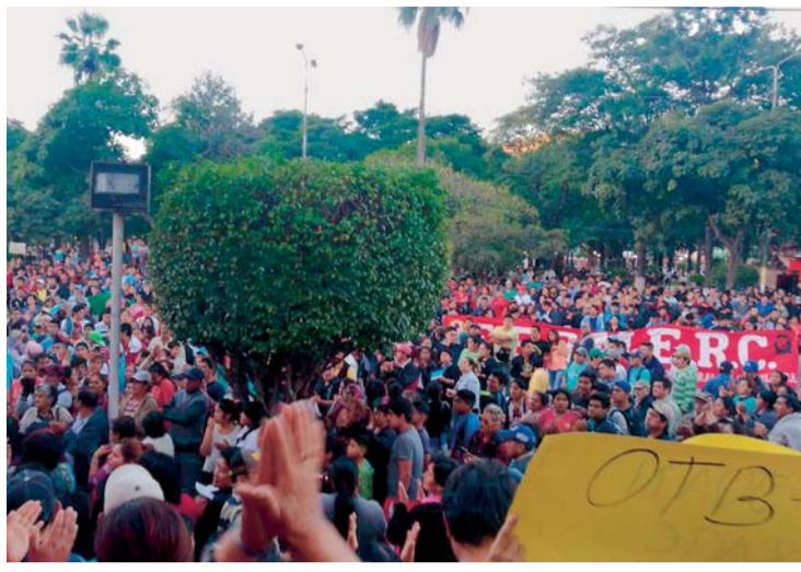
CABILDO EFECTUADO AYER EN LA PRINCIPAL PLAZA DE CAMIRI.