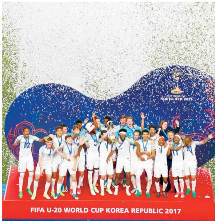
INGLATERRA CAMPEÓN SUB-20.