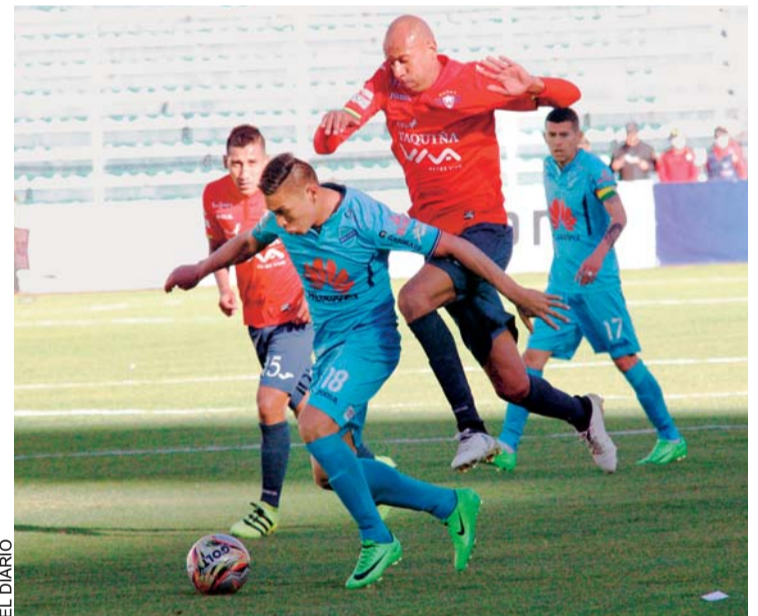
"CELESTES" HICIERON RESPETAR SU LOCALÍA FRENTE A LOS "AVIADORES".