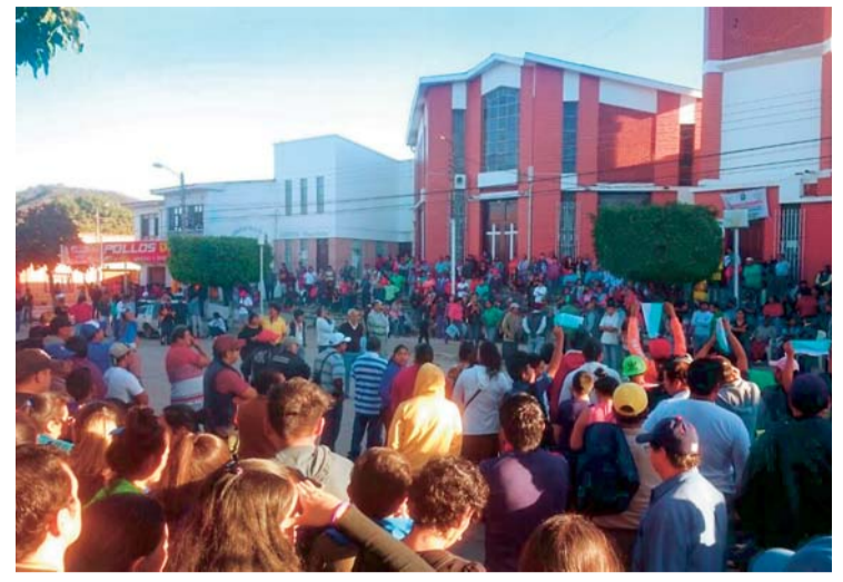
PUEBLO SIGUE FIRME EN PEDIDO DE RENUNCIA DEL ALCALDE.