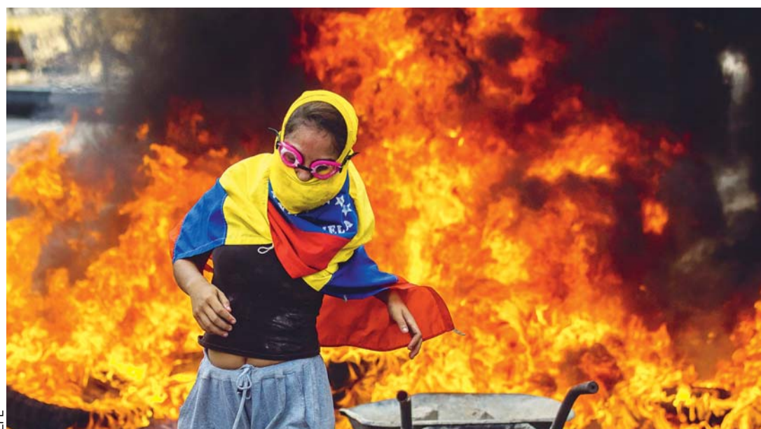
VARIOS CAMIONES FUERON INCENDIADOS Y AUTORIDADES REPORTARON OTROS TRES MUERTOS EN NUEVOS FOCOS DE PROTESTAS EN VENEZUELA CONTRA NICOLÁS MADURO.