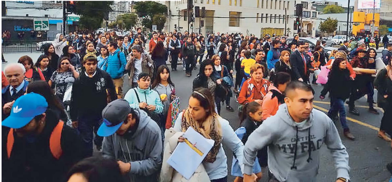
UN MOVIMIENTO TELÚRICO DE GRAN INTENSIDAD AFECTÓ A LAS REGIONES DE VALPARAÍSO, O'HIGGINS, COQUIMBO Y METROPOLITANA AL FINALIZAR LA TARDE DE ESTE LUNES. EL SERVICIO GEOLÓGICO DE ESTADOS UNIDOS (USGS) REPORTÓ UN TERREMOTO DE 7,1 GRADOS RICHTER, A 35 KILÓMETROS AL OESTE DE VALPARAÍSO Y CON 10 KILÓMETROS DE PROFUNDIDAD.