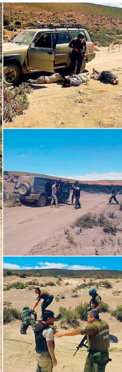
ESTAS FOTOGRAFÍAS FUERON PRESENTADAS POR AUTORIDADES CHILENAS AL JUZGADO DE POZO AL MONTE DURANTE LA AUDIENCIA DE LOS 9 BOLIVIANOS DETENIDOS. LOS COMPATRIOTAS SON SOMETIDOS A LOS EXCESOS DE LOS CARABINEROS CHILENOS.