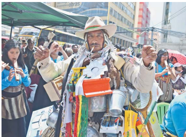
LA CIUDADANÍA PACEÑA ESPERA EL INICIO DE LA FERIA DE ALASITA 2017.

Una de las actividades importantes será la inauguración que se realizará en el Campo Ferial Bicentenario el 24 de enero. La feria durará hasta el 19 de febrero. También se organizarán visitas guiadas, exposiciones, muestras de la creación de miniaturas y los pequeños podrán conocer los orígenes.