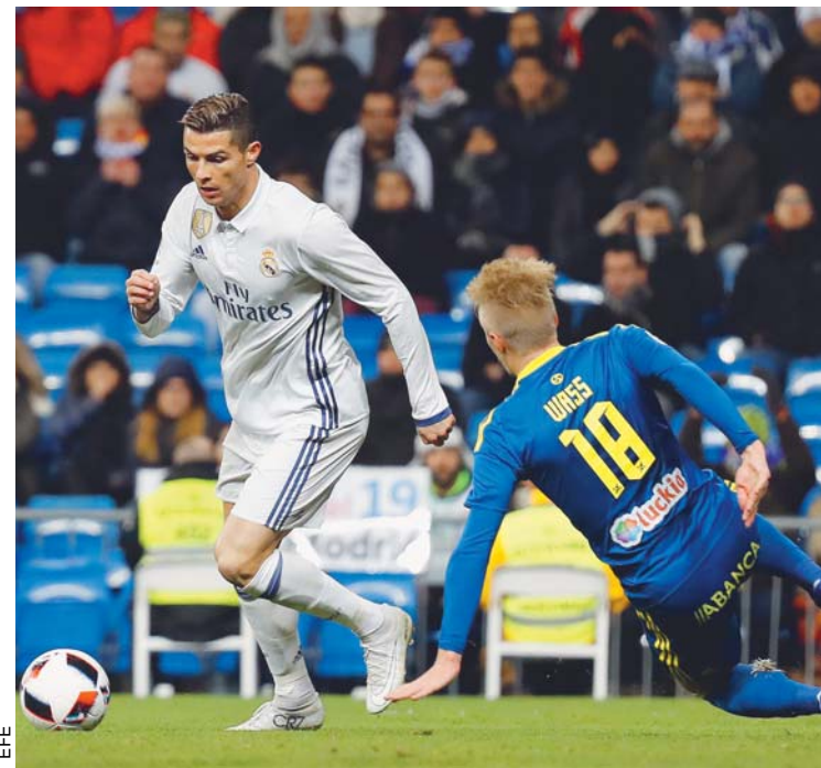
Real Madrid cayó ante Celta

El automóvil volador ha sido un concepto con el que el hombre ha soñado desde la infancia del automóvil, pero que siempre se ha visto limitado por el alcance de la tecnología del momento. Ese obstáculo parece estar llegando a su fin. El ejecutivo aeroespacial dijo tener confianza de poder hacer una prueba de demostración con un prototipo unipersonal a finales de 2017.