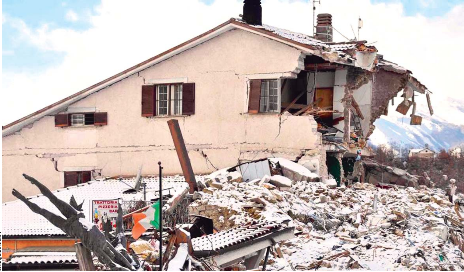
LOS TERREMOTOS SON MUY FRECUENTES EN EL CENTRO DE ITALIA. EL ÚLTIMO GRAN SEÍSMO OCURRIÓ EL PASADO 30 DE OCTUBRE, AUNQUE ENTONCES SOLO HUBO QUE LAMENTAR DAÑOS MATERIALES, EL 24 DE AGOSTO DEL AÑO PASADO, CUANDO UN GRAN TERREMOTO DEVASTÓ LA LOCALIDAD DE AMATRICE Y OTROS MUNICIPIOS CERCANOS, DEJANDO 298 MUERTOS Y MÁS DE 2.500 PERSONAS SIN HOGAR.