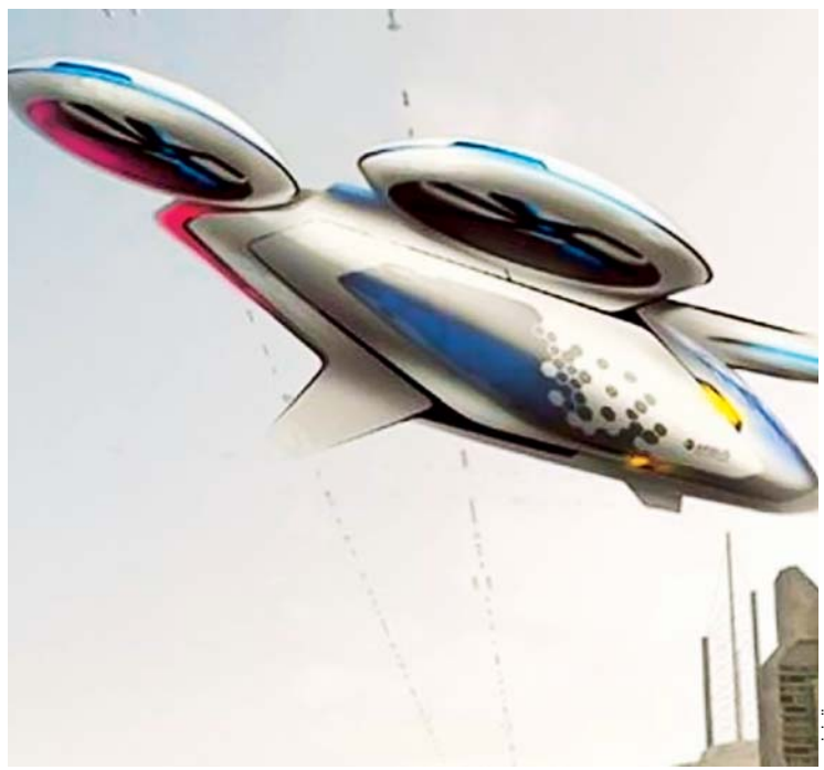
Auto volador para fin de año

Para el servicio a la población se invirtió 655 millones de bolivianos de carácter gratuito en servicio de la población.