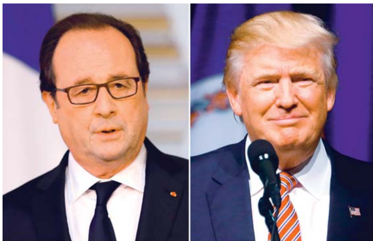
DESACUERDO ENTRE FRANÇOIS HOLLANDE Y EL PRESIDENTE ELECTO ESTADOUNIDENSE DONALD TRUMP.