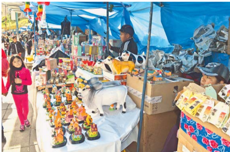
Preferia de artesanos de Alasita

EL GALLO DE FUEGO, LAS CASAS CON TANQUES DE AGUA, EDIFICIOS Y ‘CHOLETS’, ENTRE OTROS, SON LAS NOVEDADES QUE PUSIERON A LA VENTA AYER LOS ARTESANOS MAYORISTAS DE LA PREFERIA DE ALASITA 2017.