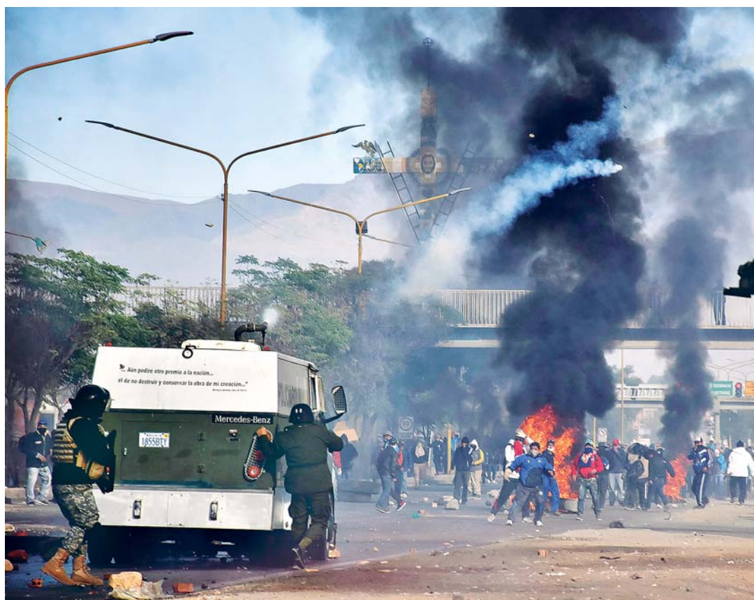
ORGANIZACIONES AFILIADAS A LA COB Y LOS EFECTIVOS POLICIALES SE ENFRENTARON EN LA CIUDAD DE COCHABAMBA, EN LA PRIMERA JORNADA DEL PARO DE 72 HORAS.

• Tres ministros minimizaron medida de protesta de la COB