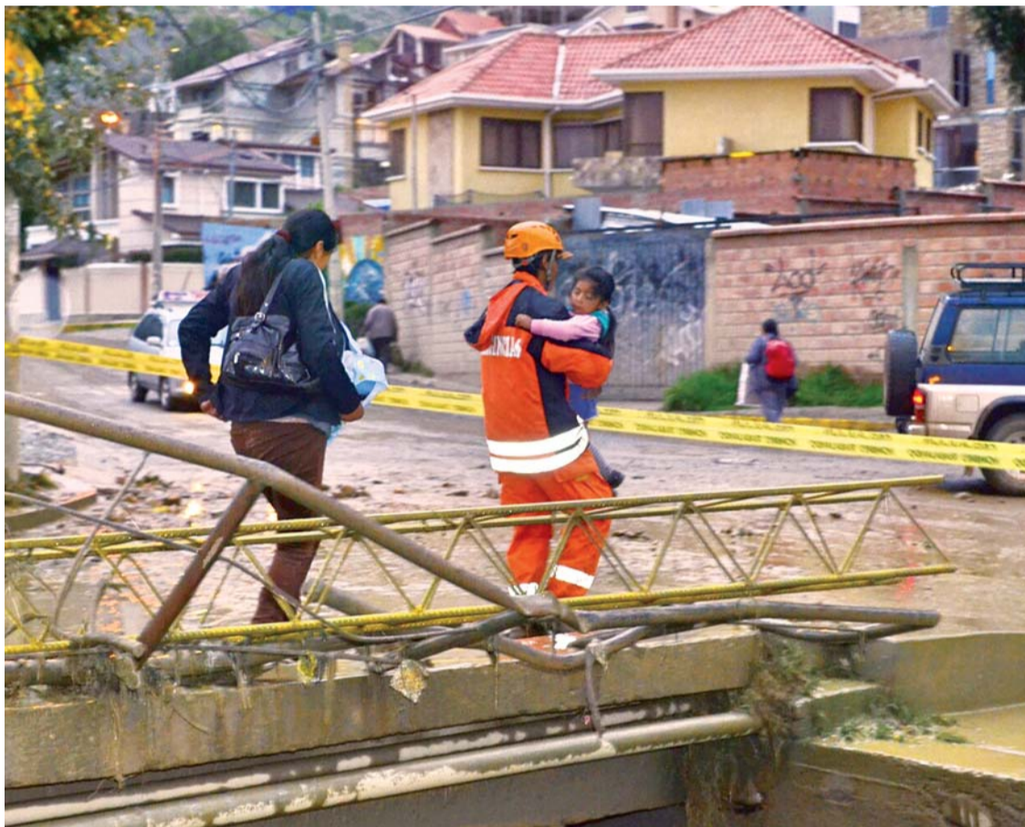
EL FUERTE CAUDAL DE AGUA DEL RÍO WAYÑAJAHUIRA PUSO EN RIESGO LA INTEGRIDAD FÍSICA DE LAS PERSONAS QUE TRANSITABAN POR SUS ALREDEDORES.

• El crecimiento del río Wayñajahuira desbordó su cauce y se convirtió por instantes en una grave amenaza para las personas y vehículos que circulaban por ese sector. El caudal registrado, que destruyó un puente y una pasarela, además de vías aledañas al río, se debió a una intensa lluvia que hubo en la zona de la cuenca alta en Ovejuyo