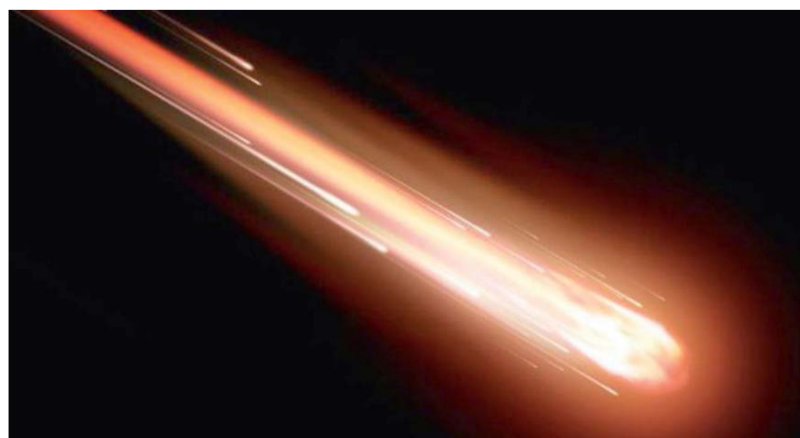
LA NOTICIA SOBRE EL METEORITO PASÓ DESAPERCIBIDA PARA LA MAYORÍA DE LOS MORTALES, PERO COMENZÓ A CIRCULAR RÁPIDAMENTE EN BLOGS Y SITIOS WEBS DE ASTRONOMÍA.