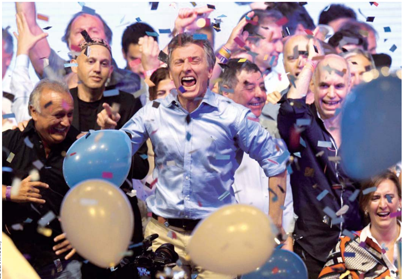
MACRI, INMINENTE GANADOR DE LAS ELECCIONES EN ARGENTINA, ALZÓ LA VOZ DE TRIUNFO JUNTO A LOS MILITANTES DEL PARTIDO "CAMBIEMOS", ANOCHE DESPUÉS DE CONOCER RESULTADOS PARCIALES DEL ESCRUTINIO.