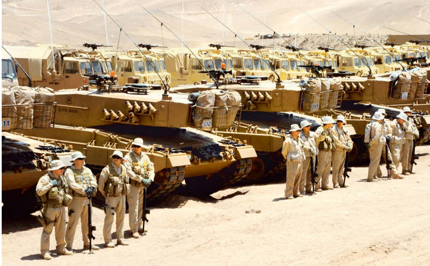
PRÁCTICA DEL EJÉRCITO CHILENO EN ZONA FRONTERIZA. LA IMAGEN PROCEDE DE ARCHIVOS DE GESTIONES PASADAS, SIMILARES A LAS QUE ACABA DE REALIZAR.