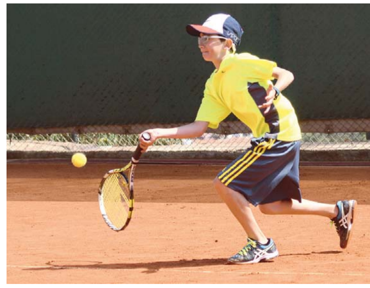
CAMPEONATO NACIONAL DE TENIS G4 EN LAS CATEGORÍAS 12, 14 Y 16 AÑOS, TANTO EN DAMAS COMO VARONES.

El certamen está reservado para las categorías 12, 14 y 16 años de edad, para el certamen llegaron numerosas delegaciones de Cochabamba, Oruro, Tarija, Chuquisaca, Beni, Santa Cruz, además de los anfitriones que tuvieron una cosecha importante en ambas ramas.