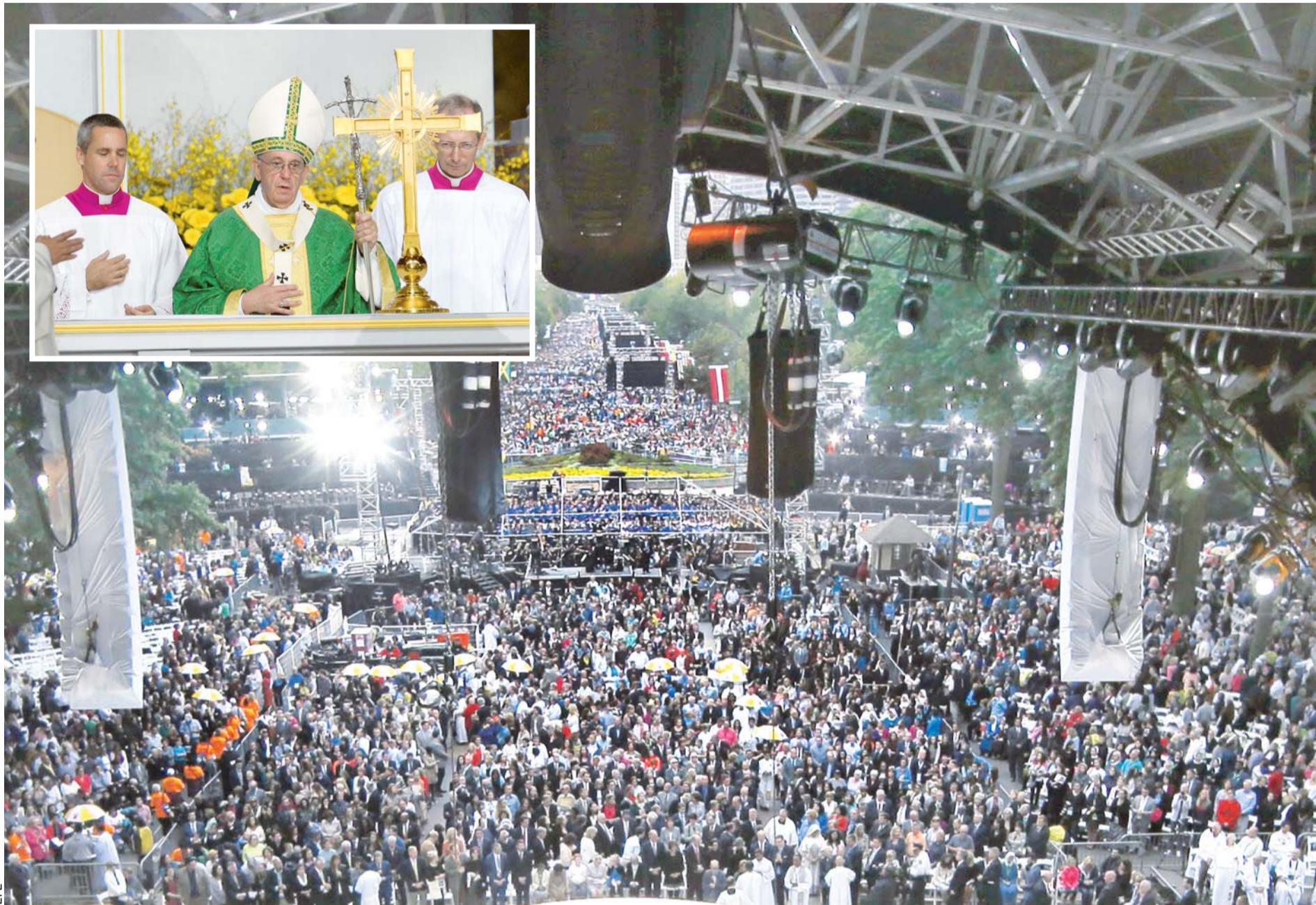
EN LA MISA, FRANCISCO SE DESPIDIÓ Y RECORDÓ LA URGENTE NECESIDAD DE CUIDAR Y PROTEGER EL MEDIOAMBIENTE, LA "CASA COMÚN".