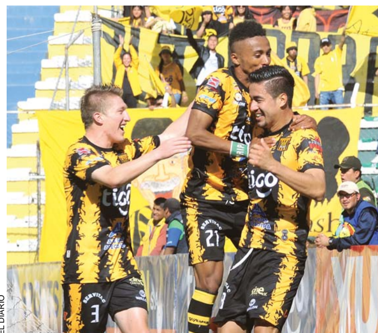
JUGADORES DE THE STRONGEST FESTEJAN LA GOLEADA QUE LOS MANTIENE COMO PUNTEROS DEL CAMPEONATO.