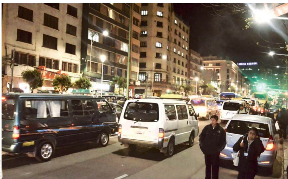
LA CIUDADANÍA ESTÁ INSATISFECHA CON EL SERVICIO DEL TRANSPORTE PÚBLICO.