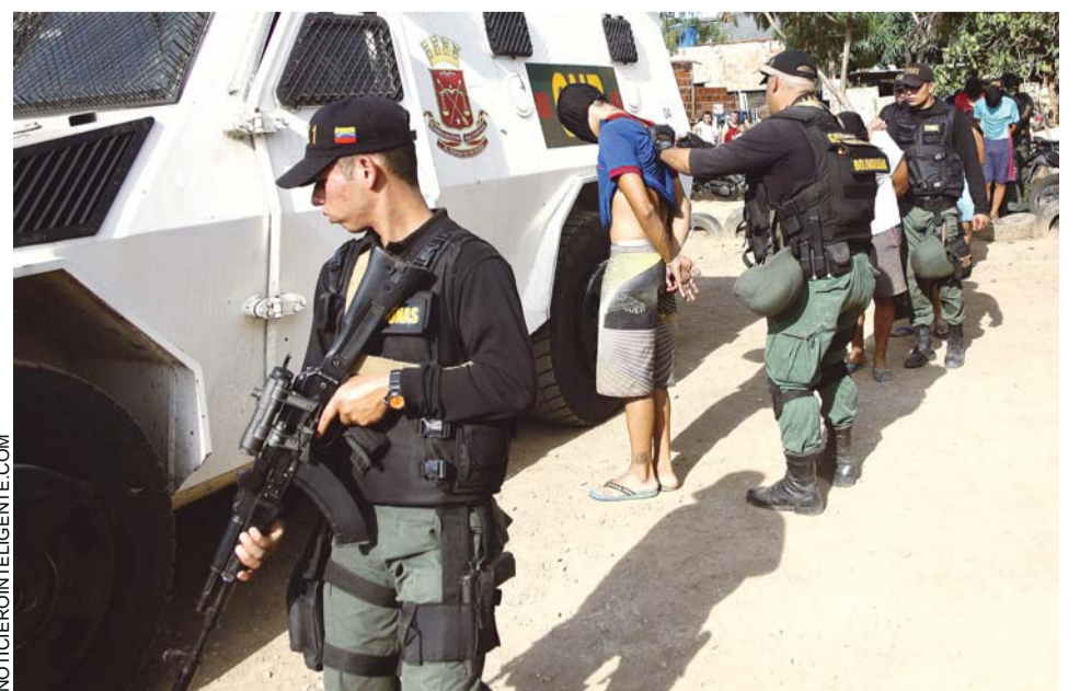
MÁS DE 1.000 COLOMBIANOS HAN SIDO DEPORTADOS DURANTE LOS OPERATIVOS REALIZADOS EN EL MARCO DEL ESTADO DE EXCEPCIÓN.