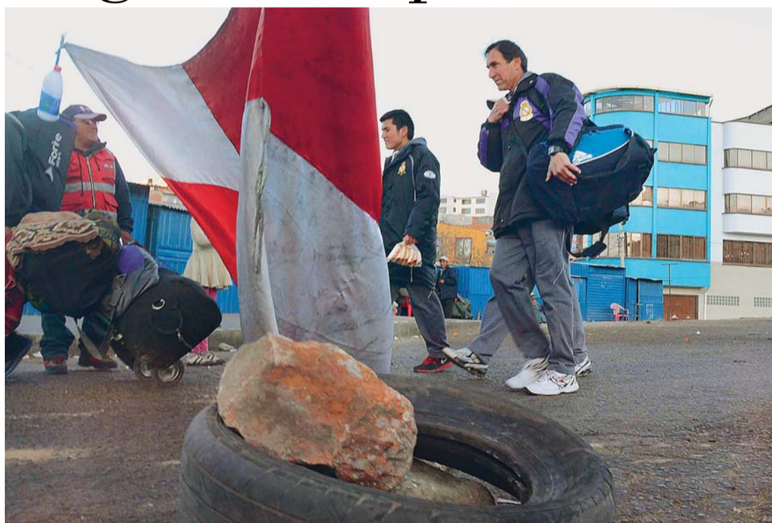
JUGADORES DE REAL POTOSÍ ATRAVIESAN A PIE EL BLOQUEO DISPUESTO POR LA ENTIDAD CÍVICA. ENTRETANTO, EN LA PAZ LA POSICIÓN DE COMCIPO PERSISTE.

El paro indefinido que fue declarado por la entidad cívica de la Villa Imperial exige a las autoridades gubernamentales y a sus representantes cívicos diálogo inmediato para retornar a la normalidad y otro grupo persiste en la intención de buscar atención inmediata a sus demandas regionales.