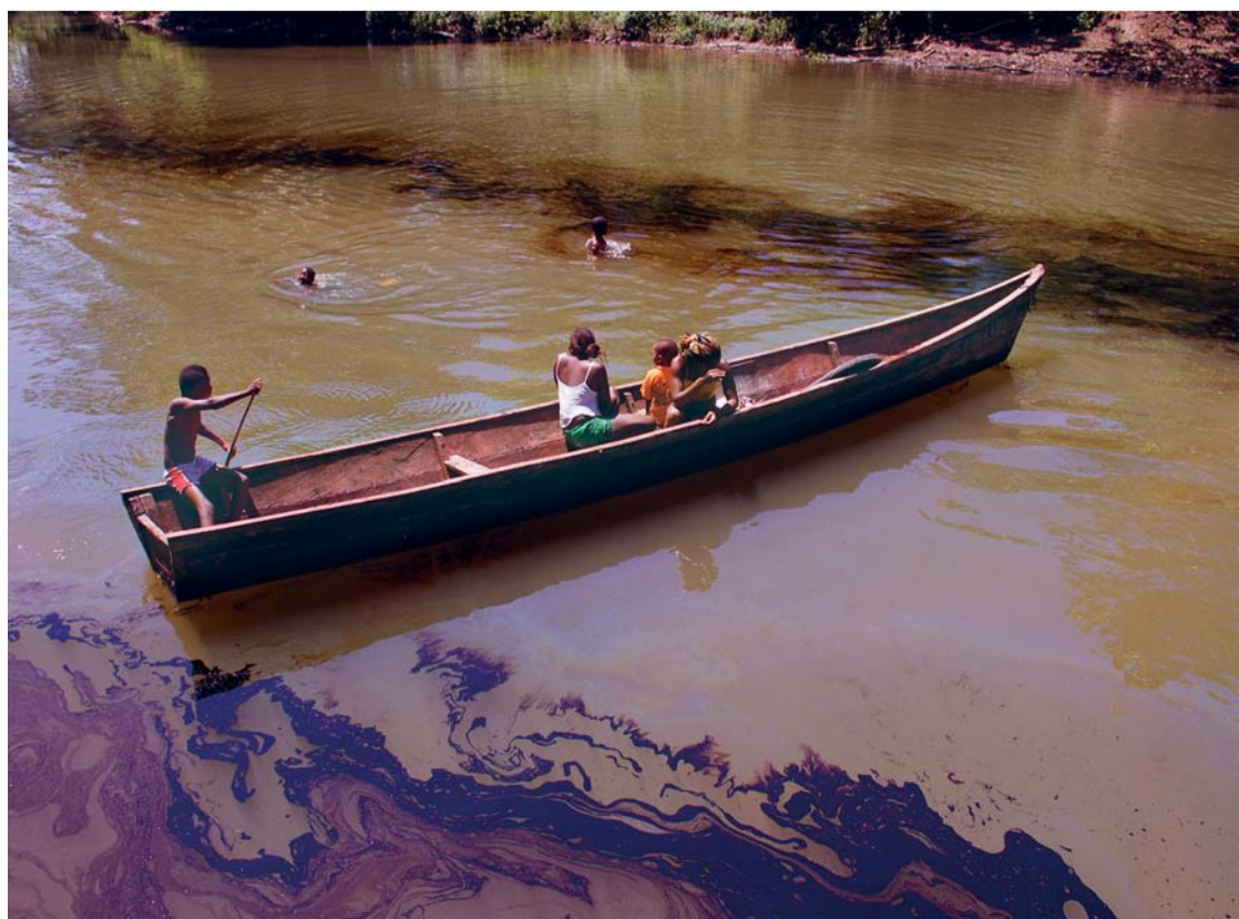
EL ÚLTIMO ATAQUE GUERRILLERO HA MANCHADO DE PETRÓLEO MÁS DE 80 KILÓMETROS DEL RÍO MIRA, EN TUMACO, DEJANDO 160 MIL HABITANTES DE NARIÑO SIN AGUA POTABLE.

Hay una tendencia a subir de peso y la grasa corporal se distribuye de manera distinta; en vez de acumularse en las caderas se va a la barriga y al tórax. Por lo tanto, corremos mayor riesgo de tener problemas cardiovasculares, diabetes o hipertensión arterial. Los huesos también se alteran con la disminución de estrógenos. Si no se los cuida, se puede producir una descalcificación ósea y el riesgo de tener osteoporosis se incrementa.