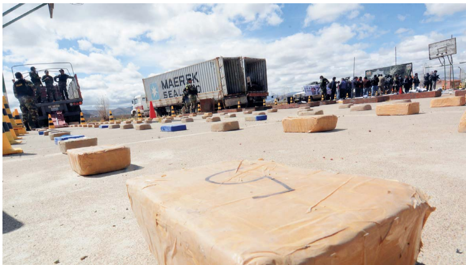
Caen narcos con nexos mexicanos y europeos

UN OPERATIVO POLICIAL EN LA FRONTERA CON CHILE PERMITIÓ CONFISCAR 654 KILOGRAMOS DE CLORHIDRATO DE COCAÍNA CONTENIDA EN 623 PAQUETES TAMAÑO LADRILLO ENVUELTOS CON CINTA MASKING. LA DROGA CAMUFLADA EN UNA CARGA DE CHATARRA ESTÁ VALUADA EN 48 MILLONES DE DÓLARES. EL MINISTRO HUGO MOLDIZ EXPLICÓ QUE LA DROGA SEQUESTRA