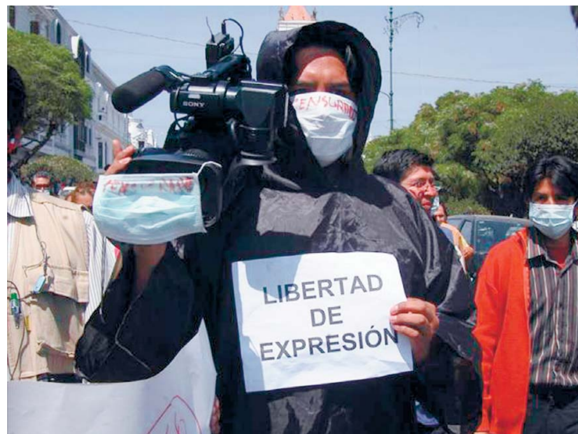
LOS MEDIOS IMPRESOS Y AUDIOVISUALES ESTÁN BAJO EL CONTROL ABSOLUTO DEL ESTADO COMUNISTA DE PARTIDO ÚNICO.

Escrita y dirigida por Joss Whedon, la película presenta un elenco que incluye a Chris Evans, Robert Downey Jr., Mark Ruffalo, Chris Hemsworth, Scarlett Johansson, Jeremy Renner, Cobie Smulders, Aaron Taylor-Johnson, Elizabeth Olsen, James Spader, Samuel L. Jackson, Paul Bettany, Don Cheadle y Claudia Kim. El estreno de "Avengers: Era de Ultrón" en nuestro medio será la próxima semana.