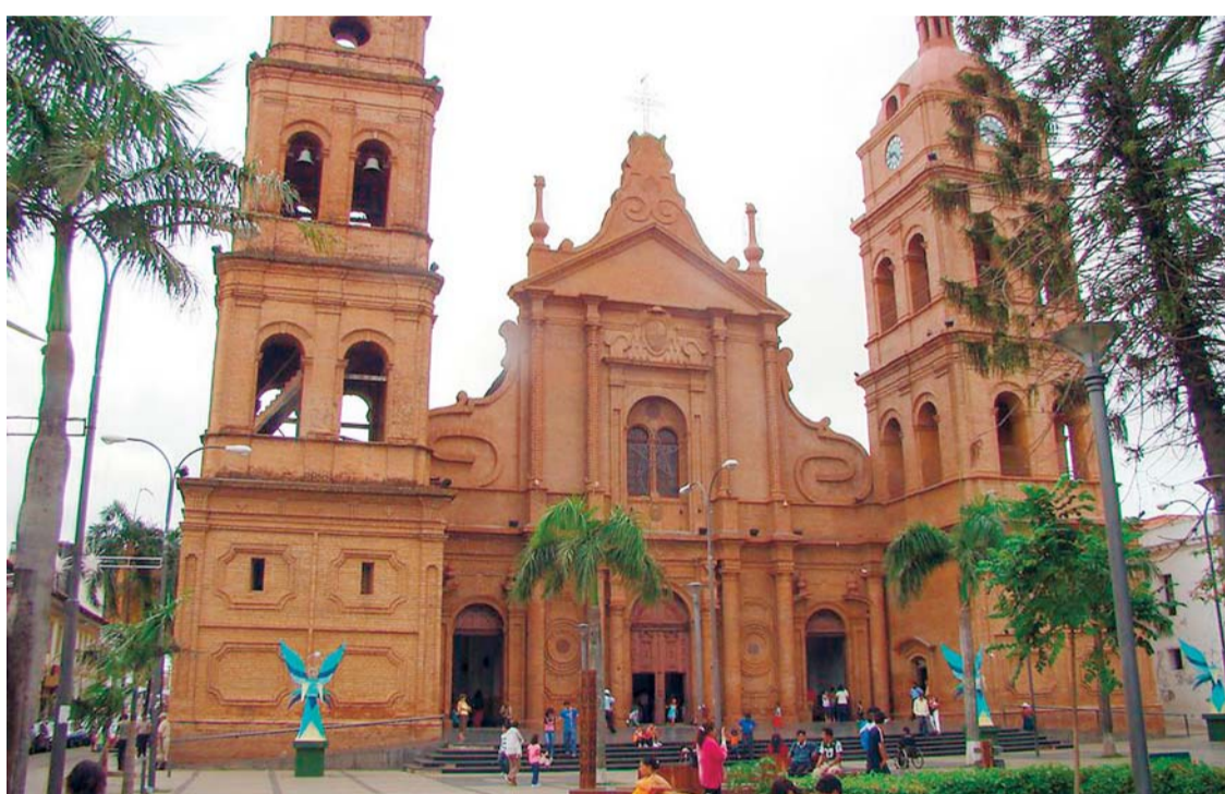
CATEDRAL METROPOLITANA BASÍLICA DE SAN LORENZO, SANTA CRUZ DE LA SIERRA.