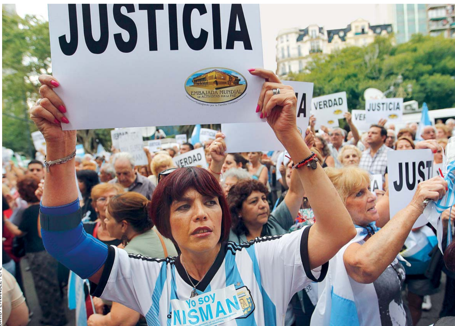
MANIFESTANTES PROTESTAN CON CARTELES EN LA MARCHA CONVOCADA POR LOS FISCAL ARGENTINOS EN HOMENAJE AL FISCAL ALBERTO NISMAN EN BUENOS AIRES (ARGENTINA). CON LOS FISCAL