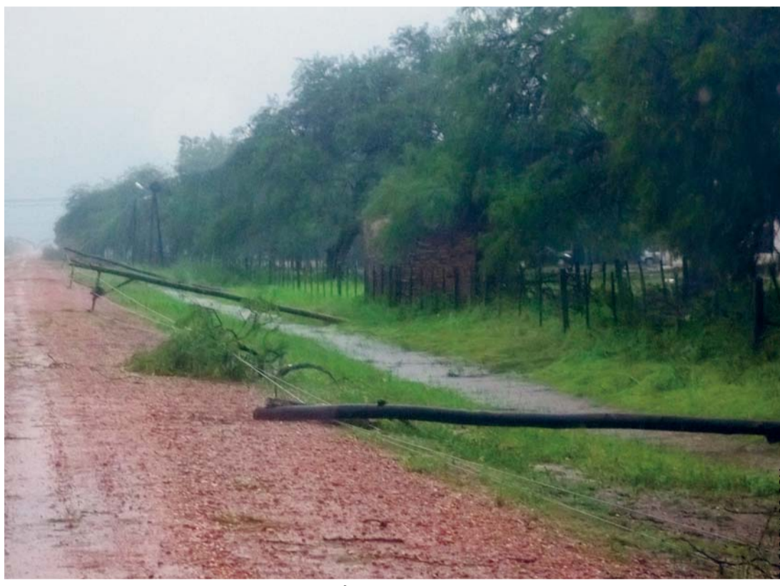
EL FUERTE TEMPORAL DE LLUVIA AFECTÓ DE MANERA PREOCUPANTE A LOS HABITANTES DE LA REGIÓN DEL CHACO. ESTA MISMA SITUACIÓN SUFREN LOS COMUNARIOS COCHABAMBINOS.

• Intensas lluvias, granizadas y heladas registradas el fin de semana afectaron a 300 familias y destruyeron alrededor de 200 hectáreas de cultivos agrícolas en distritos municipales de Arani, Tarata y Arbieto. En la región del Chaco y el norte de La Paz cierran caminos por derrumbes.