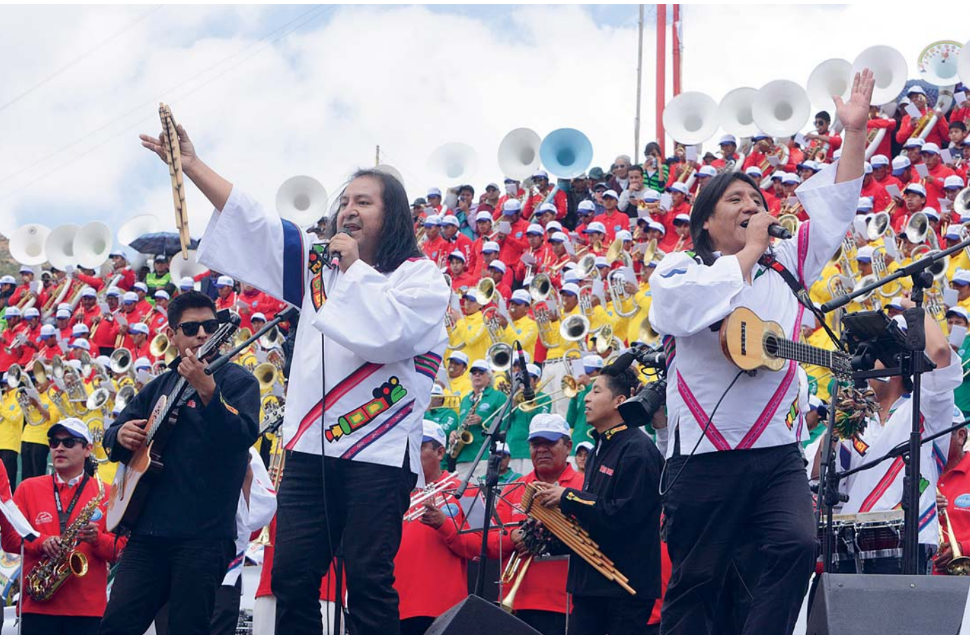
Concierto de bandas alcanzó nuevo récord

EL FESTIVAL DE BANDAS QUE FUE ENGALANADO AYER POR SIETE MIL MÚSICOS DIO PASO AL CARNAVAL DE ORO, PATRIMONIO INTANGIBLE DE LA HUMANIDAD. LAS VOCES, TROMPETAS Y BOMBOS SE FUSIONARON A LAS INTERPRETACIONES MUSICALES DE GRUPOS RECONOCIDOS DEL PAÍS COMO KALAMARKA, LLAJTAYMANTA Y YARA.