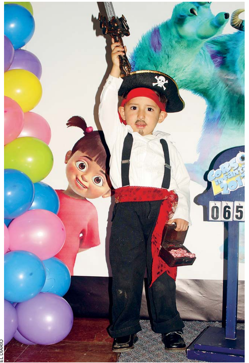
EL DIARIO INVITA A LOS NIÑOS Y NIÑAS A VIVIR LOS MOMENTOS MÁS FELICES JUNTO A SUS PADRES EN EL "CORSO INFANTIL 2015".

El matutino EL DIARIO, una vez más, se suma a la fiesta del Carnaval para compartir con los más pequeños de la familia momentos de alegría, amor e integración, a través del Corso Infantil. Por lo que les invita a los niños, niñas y sus familias a tomarse fotografías con disfraces de los personajes favoritos de la televisión.