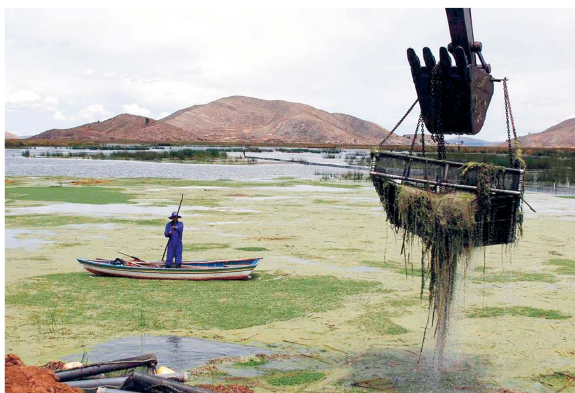
EXISTE PREOCUPACIÓN ENTRE POBLADORES CERCANOS AL LAGO TITICACA POR EL GRADO DE CONTAMINACIÓN EN LA REGIÓN LACUSTRE.

Para hoy se tiene programado el Corso Infantil y el sábado 14 se desarrollará la gran entrada de comparsas.