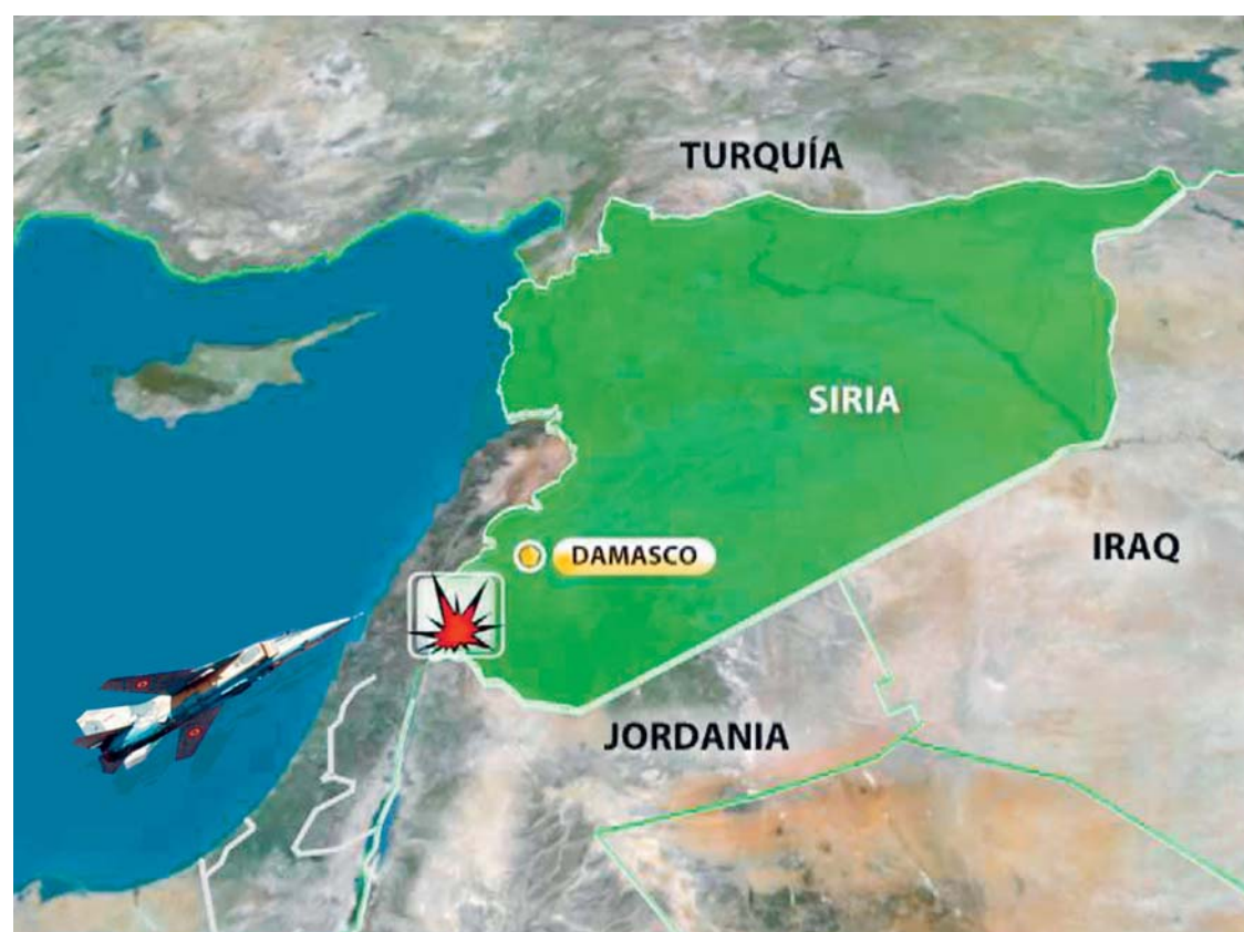
AL MENOS TRES MIEMBROS DEL GRUPO CHÍ LIBANÉS HIZBULÁ MURIERON EN LOS BOMBARDEOS ISRAELES DE AYER EN LA PERIFERIA DE DAMASCO, SEGÚN EL OBSERVATORIO SIRIO DE DERECHOS HUMANOS.