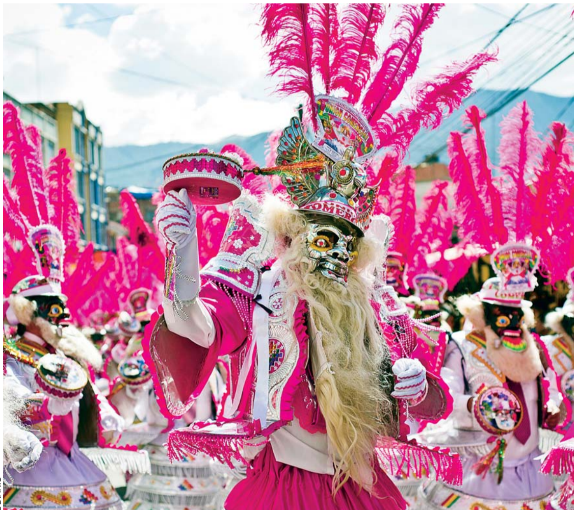
Protesta simultánea contra robo de folklore