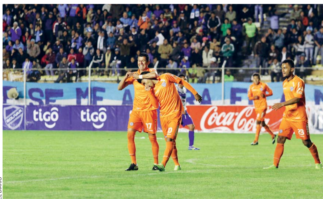
LA NOCHE DE REAPERTURA DEL ESTADIO HERNANDO SILES FUE GRATIFICANTE PARA LA HINCHADA BOLIVARISTA. LA ACADEMIA GOLEÓ A SAN JOSÉ DE URURO.

El carácter opuesto atrae porque complementa, porque la persona es como nos gustaría ser, pero no podemos. Sin embargo, cuando una pareja se destaca por ser ambos muy diferentes, es una gran oportunidad para poder crecer.