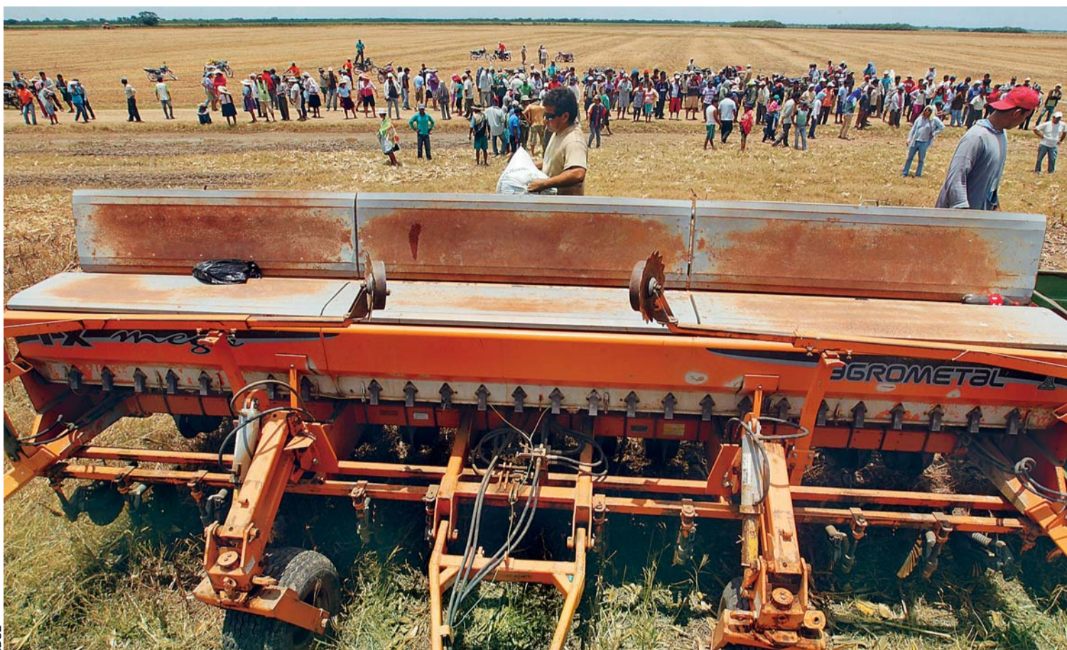
LAS ACCIONES ILEGALES DE AVASALLADORES PARALIZAN LA MAQUINARIA DESTINADA PARA IMPULSAR EL DESARROLLO AGROPECUARIO EN SANTA CRUZ, AL IGUAL QUE EN OTROS DEPARTAMENTOS DEL PAÍS. LA SOLUCIÓN DE ESTOS CASOS AÚN SE HACE ESPERAR.

Los estrenos de la semana. La terrorífica 'Annabelle'; el romance y suspenso con Ewan McGregor y Eva Green en 'Al final de los sentidos' y 'Perdida' con Ben Affleck y dirigida por David Fincher.