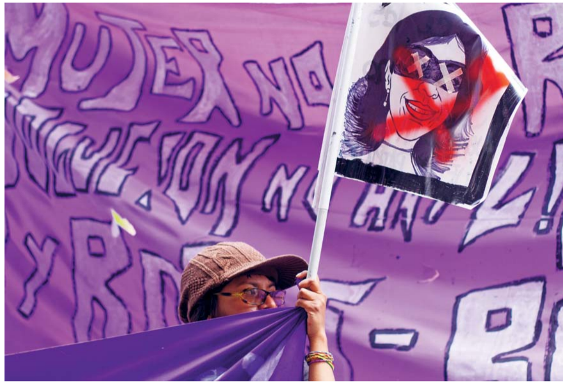
EN LA CIUDAD DE LA PAZ, VARIAS ACTIVISTAS MARCHARON Y LA PROTESTA CONTRA LA VIOLENCIA A LA MUJER CONCLUYÓ EN INMEDIACIONES DE LA VICEPRESIDENCIA DEL ESTADO.

De los 59 casos de feminicidio registrados en el país, 21 ocurrieron en el departamento de Cochabamba, 16 en La Paz, ocho en Santa Cruz, seis en Oruro, cuatro en Potosí y tres en Chuquisaca. De los restantes 39 feminicidios las causas responden a motivos conyugales, 14 sexuales y seis feminicidios infantiles.