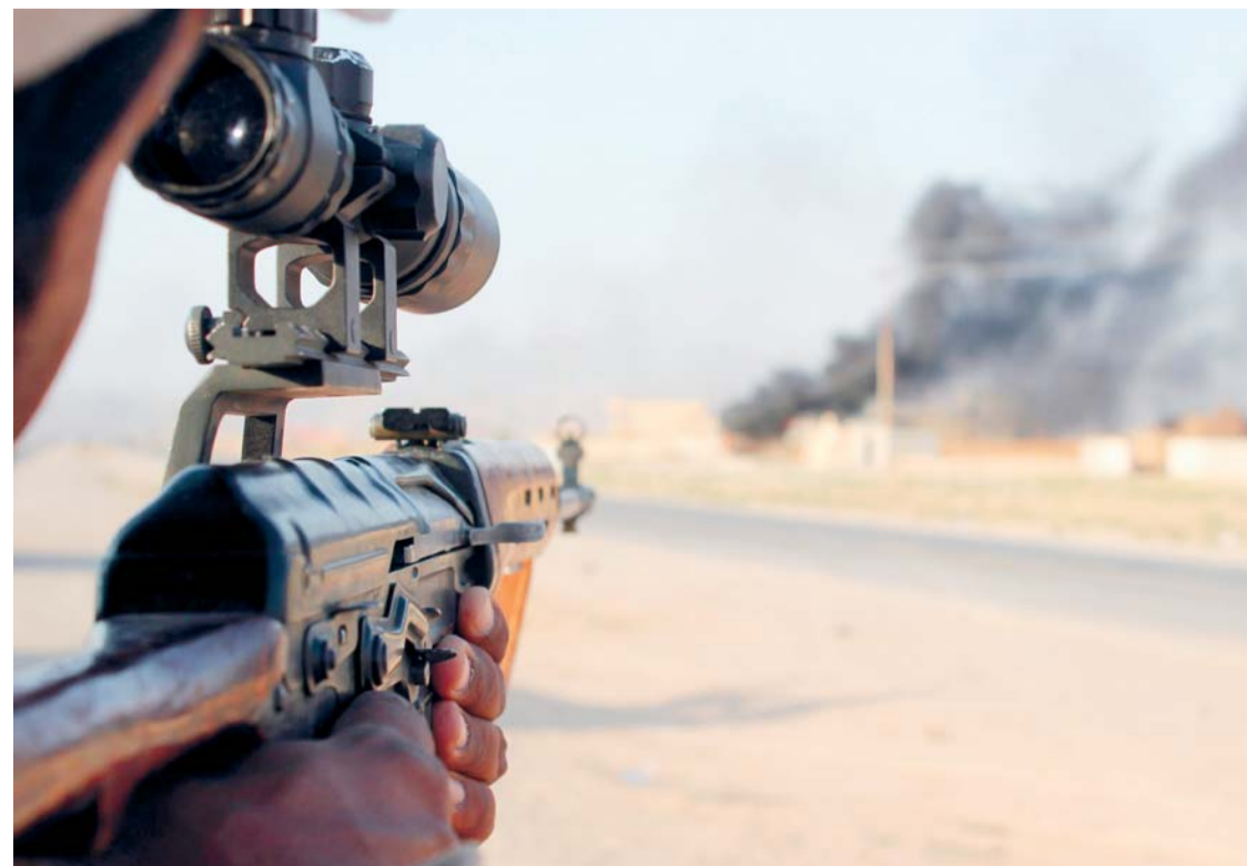
UN VOLUNTARIO CHIÍ DE LA MILICIA BRIGADAS DE HIZBULÁ APUNTA SU RIFLE DURANTE COMBATES CONTRA MILITANTES DEL GRUPO ESTADO ISLÁMICO (EI) EN AMERLI (IRAQ).

En Fort Detrick, hace un año, un equipo de científicos inoculó el virus ébola a un grupo de macacos. En los días siguientes, los monos comenzaron a sentir los síntomas de la infección, normalmente la antesala de la muerte.