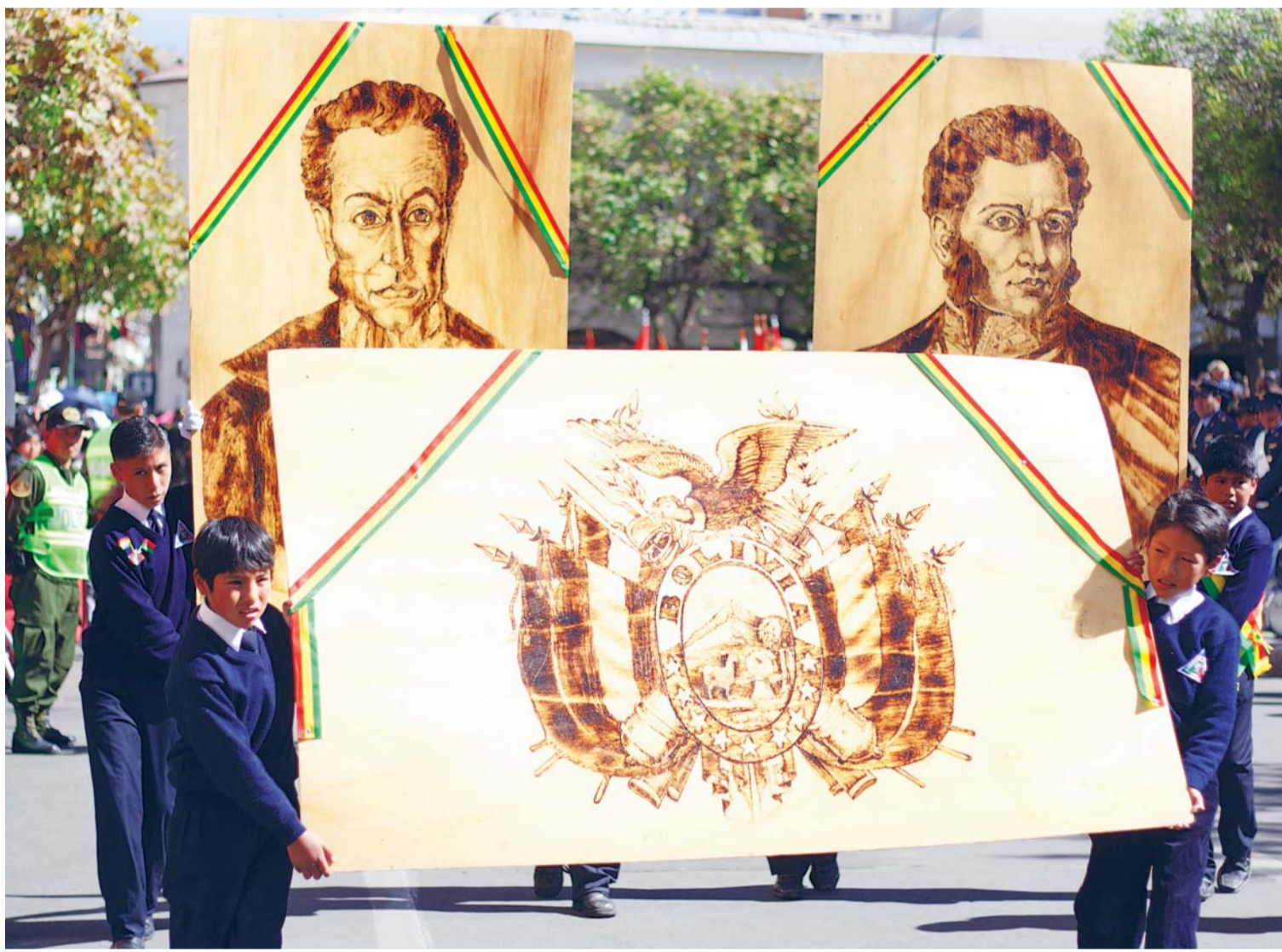
EL PAÍS NACE A LA VIDA INDEPENDIENTE EL 6 DE AGOSTO DE 1825, CUANDO EL CONGRESO, REUNIDO EN CHUQUISACA, FUNDA LA REPÚBLICA BOLÍVAR EN HOMENAJE AL LIBERTADOR, DENOMINACIÓN QUE CAMBIA EL 3 DE OCTUBRE DEL MISMO AÑO CON EL NOMBRE DE REPÚBLICA DE BOLIVIA, HOY ESTADO PLURINACIONAL DE BOLIVIA.