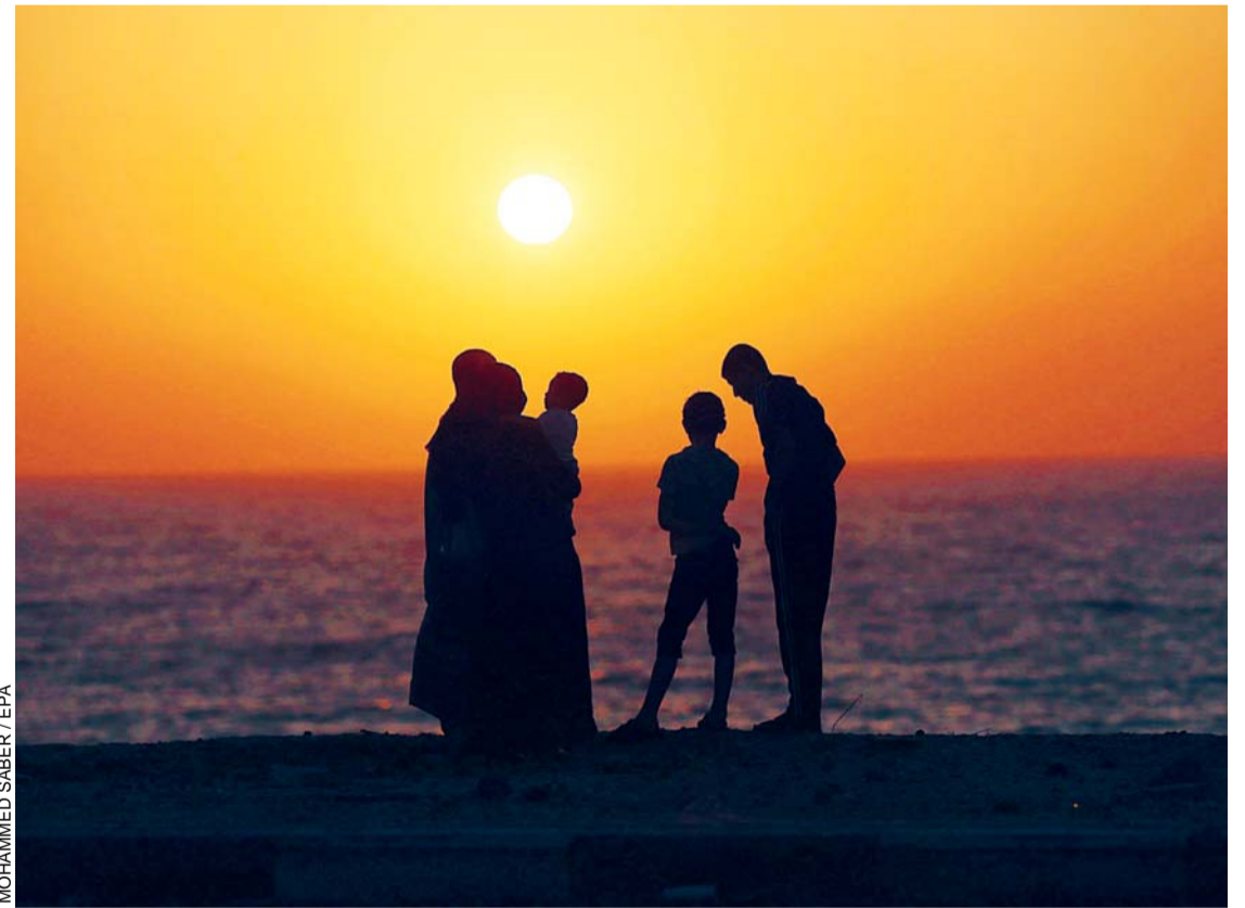
TRAS 29 DÍAS DE SANGRIENTOS ENFRENTAMIENTOS, UNA FAMILIA PALESTINA PASEA POR LA PLAYA DE GAZA, DEBIDO A UN ALTO EL FUEGO DE 72 HORAS, EN LA QUE MEDIA EGIPTO, MIENTRAS QUE ISRAEL RETIRÓ SUS FUERZAS TERRESTRES DE GAZA.

La población de la Franja de Gaza salió a las calles y otros regresaron a sus hogares tras la retirada de las tropas terrestres de Israel y la puesta en vigor de un alto el fuego de 72 horas pactado el lunes con la mediación de Egipto.