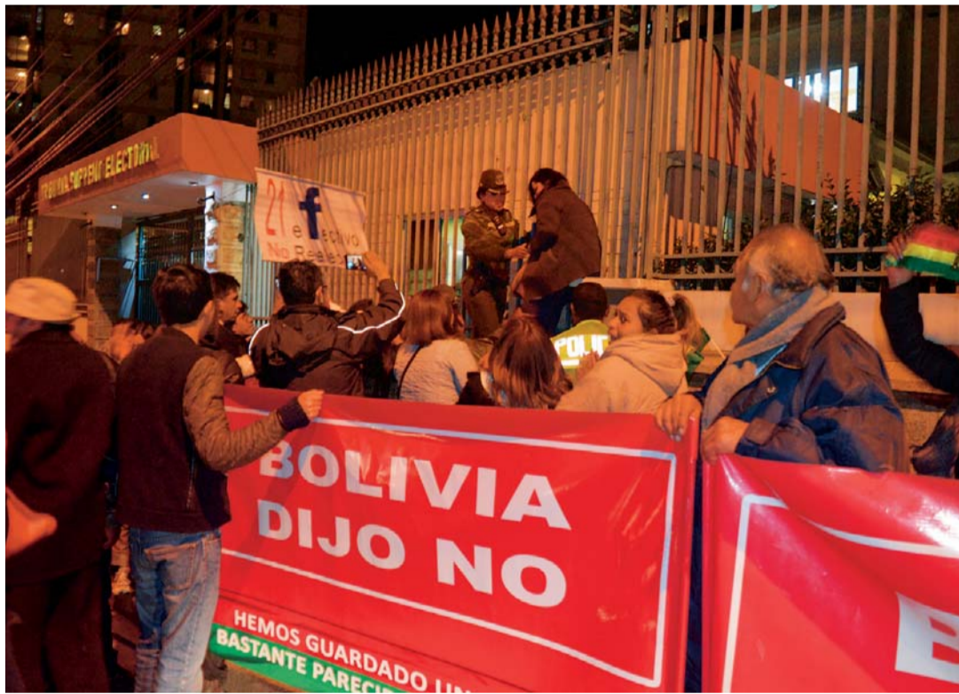
PLATAFORMAS CIUDADANAS EXPRESARON SU PROTESTA EN INMEDIACIONES DEL TRIBUNAL SUPREMO ELECTORAL ANTE LA INTENCIÓN DEL MAS DE REPOSTULAR AL PRESIDENTE EVO MORALES.