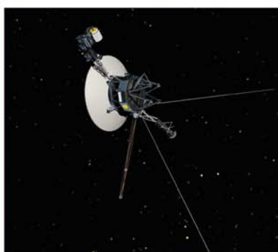
LA VOYAGER 1, PRIMERA NAVE INTERESTELAR, CUMPLE 41 AÑOS DE VIAJE.