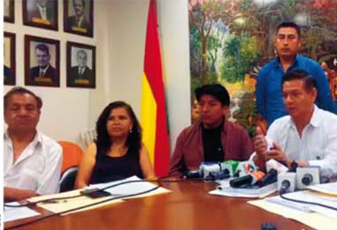
REPRESENTANTES DE CINCO COMITÉS CÍVICOS SE REUNIERON EN SANTA CRUZ.