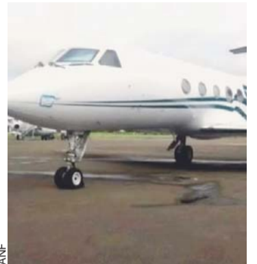
JET INACUTADO CUMPLIÓ PROTOCOLO DE INGRESO.