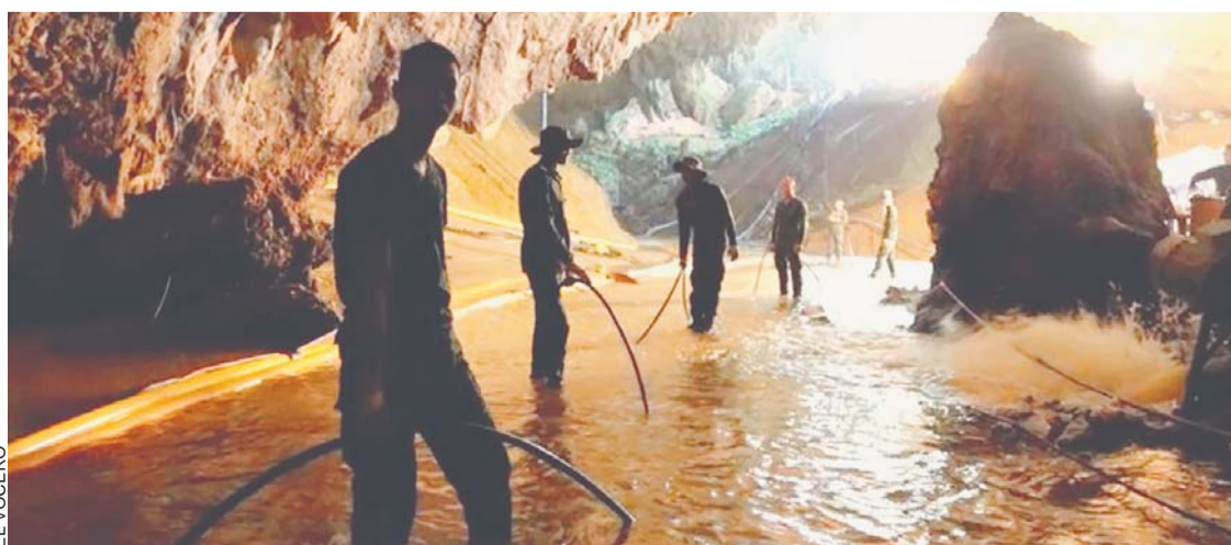
LABORES DE RESCATE DE LOS NIÑOS Y SU TUTOR QUE SE ENCUENTRAN ATRAPADOS EN UNA CUEVA DE TAILANDIA.

Las operaciones de rescate quedaron interrumpidas tras nueve horas para descansar y preparar la tercera misión, que podría iniciarse mañana, con el objetivo de sacar al resto.