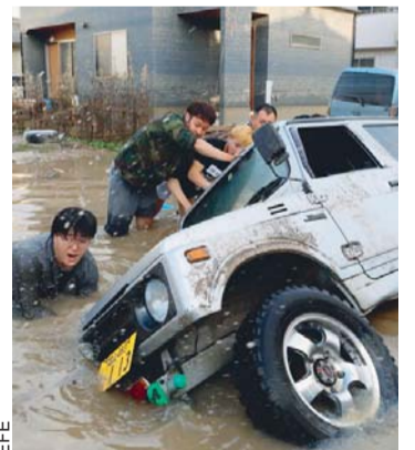
RESCATE A VEHÍCULO ATRAPADO.

Un total de 126 personas han muerto y 60 se encuentran desaparecidas, según los últimos datos oficiales, por las lluvias torrenciales caídas en Japón en los últimos días, una de las peores catástrofes naturales de este tipo ocurrida en décadas en el país.