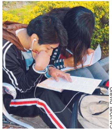
LA CALLE FUE SU AULA.