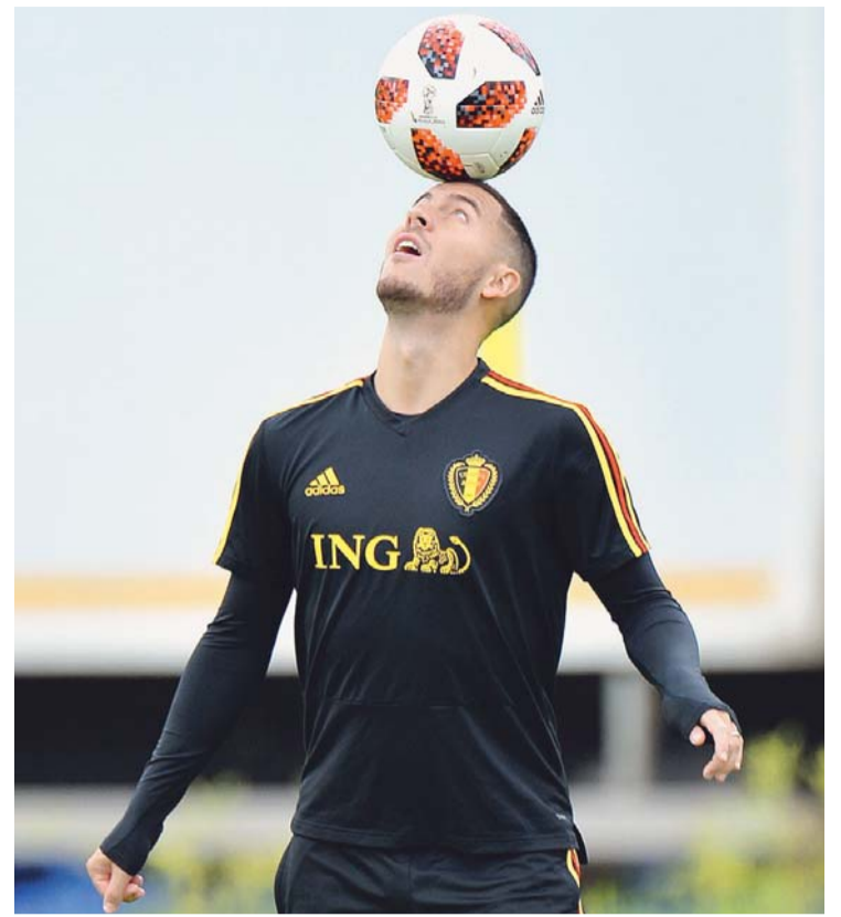
EDEN HAZARD DE BÉLGICA.