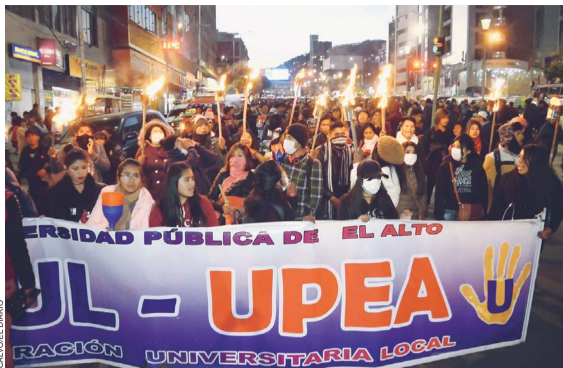
UPEA marchó de noche y con teas

ESTUDIANTES DE LA UNIVERSIDAD PÚBLICA DE EL ALTO-UPEA ANOCHE PROTAGONIZARON UNA MARCHA DE TEAS EN RECHAZO AL PROYECTO DE LEY SOBRE EL PRESUPUESTO PLANTEADO POR EL GOBIERNO.