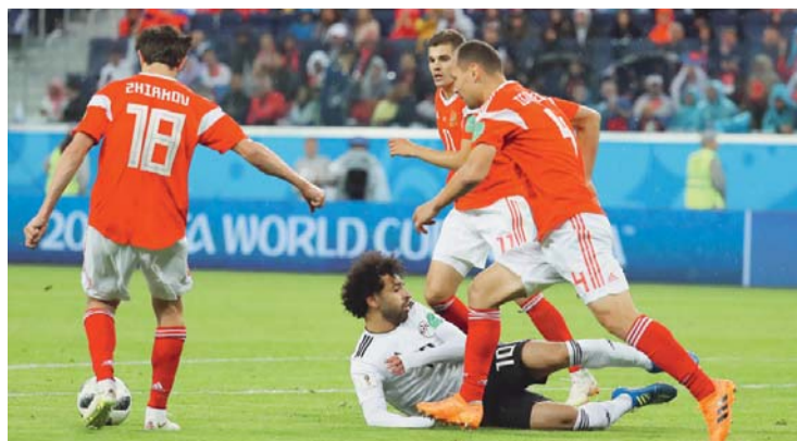
EL DUELO ENTRE RUSOS Y EGIPCIOS DURANTE LA JORNADA FUTBOLERA DE AYER.