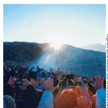
RECEPCIÓN DE LOS PRIMEROS RAYOS DE SOL DE INVIERNO.