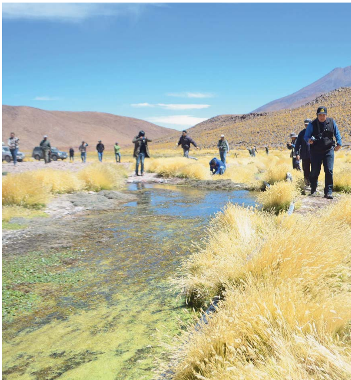
LAS AGUAS DEL SILALA NACEN EN POTOSÍ. ES UN RECURSO NATURAL DE BOLIVIA.