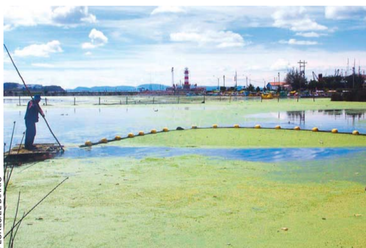
TRABAJO DE DESCONTAMINACIÓN EN EL LAGO TITICACA.

Especialistas alertaron que de continuar los niveles de contaminación de las aguas del lago Titicaca por las descargas tóxicas de El Alto y de 32 municipios lacustres que precipitan todo tipo de materiales a la bahía de Cohana, en menos de 20 años el lago más alto y navegable del mundo sufrirá graves consecuencias, lo que podría poner en alto