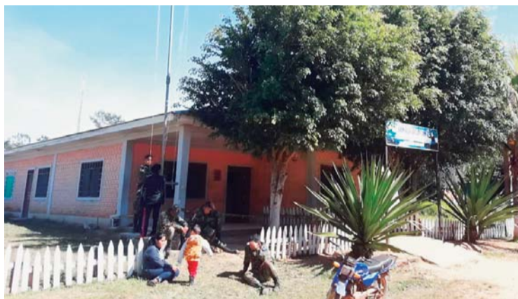
DEPENDENCIA DE LA ARMADA BOLIVIANA QUE FUE ATRACADA EN PANDO.