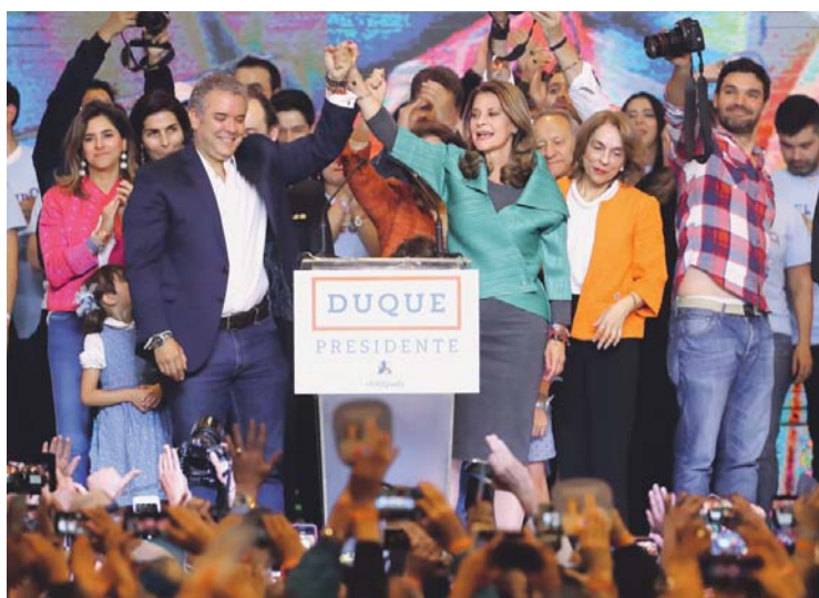
IVÁN DUQUE, CANDIDATO "URIBISTA" ES EL NUEVO PRESIDENTE DE COLOMBIA.