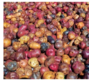
PAPAS DE COLORES.