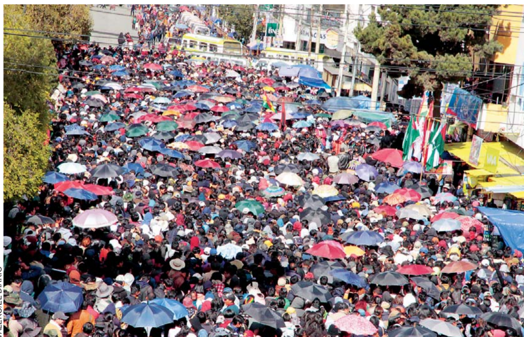
MOVILIZACIÓN QUE REALIZARON AYER LOS POBLADORES DE EL ALTO.