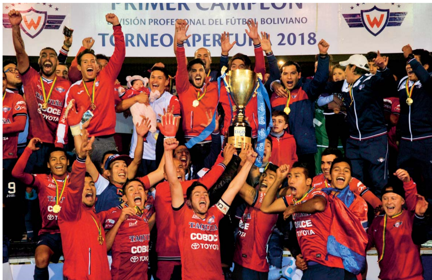
Wilsterman es campeón del Apertura

De pronto eres capaz de pasar de la alegría más absoluta a una tristeza infinita en raudos segundos. ¿Y todo por amor? No, más bien porque tu cerebro está drogado: a amor de hormonas.