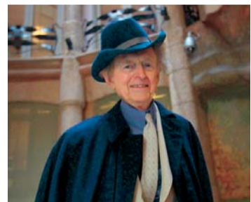
ESCRITOR ESTADOUNIDENSE TOM WOLFE.