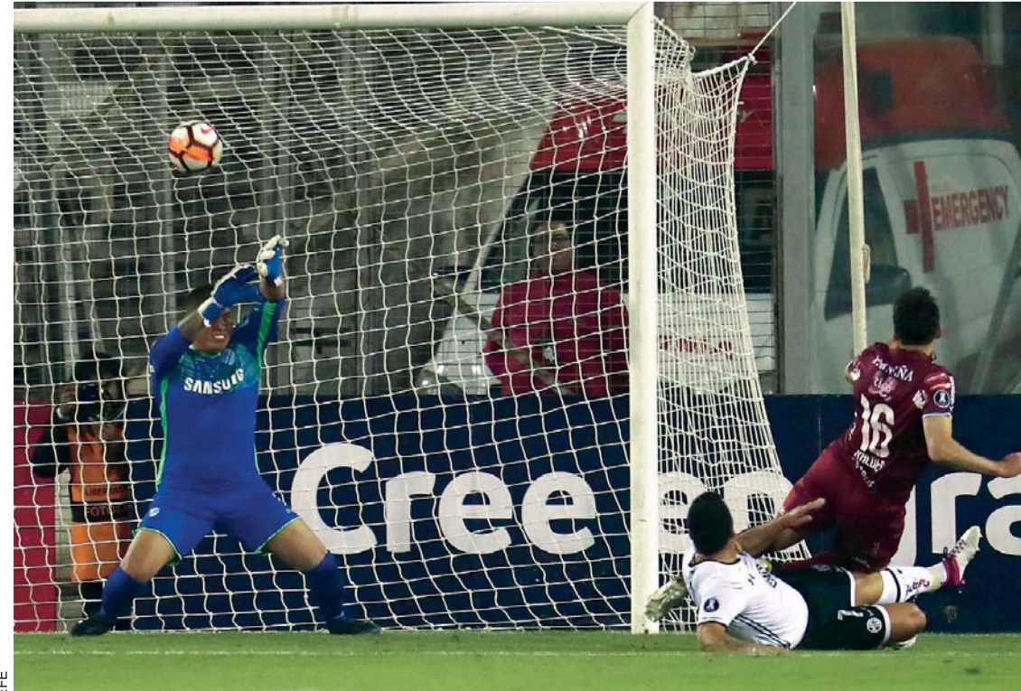
GOL DE COLO COLO ANTE UNA DEFENSA DÉBIL Y UN ARQUERO INSEGURO. FUE ANOche EN CHILE, CUANDO CAYÓ BOLÍVAR POR COPA LIBERTADORES.