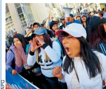
PROTESTAS CALLEJERAS DE ESTUDIANTES ALTEÑOS EN LA SEDE DE GOBIERNO.

Estudiantes de la Universidad Pública de El Alto (UPEA) marcharon por las principales calles del centro paceño, en demanda de mayor presupuesto. La movilización generó caos y congestión en varios sectores de la sede de Gobierno.