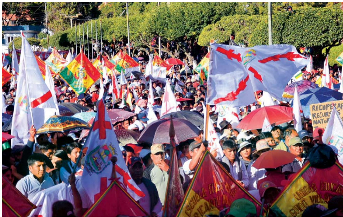
CABILDO CÍVICO-CIUDADANO EN CHUQUISACA EXIGE LA RENUNCIA DE SUS AUTORIDADES.

• En Cochabamba, la delegación capitalina abandonó la reunión convocada por Yacimientos Petrolíferos Fiscales Bolivianos (YPFB), en la que se ratificó que el 100% del campo gasífero se encuentra en territorio cruceño