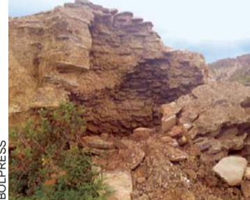
CHULLPA DE ORIGEN PREINCAICO, UBICADA EN CHIJIPIATA KELLUMAN.