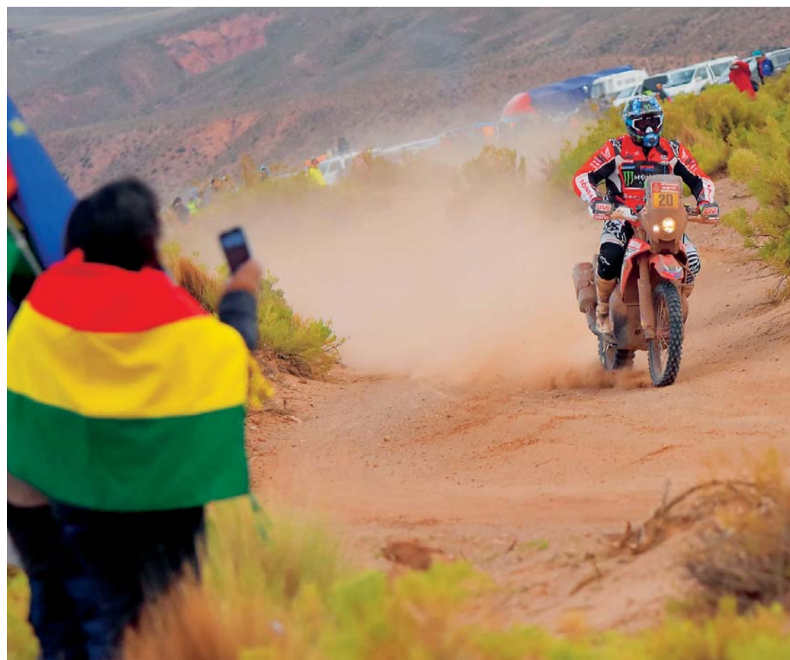
IMAGEN DE LA COMPETENCIA DAKAR 2018, PASANDO POR TERRITORIO BOLIVIANO.