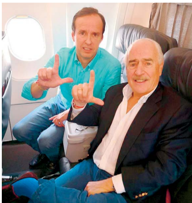
EXPRESIDENTES QUIROGA Y PASTRANA EN EL AVIÓN QUE LOS DEVOLVIÓ A SUS RESPECTIVOS PAÍSES.