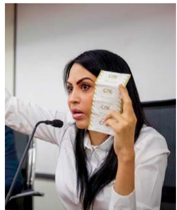
PRESIDENTA DE LA COMISIÓN DE POLÍTICA INTERIOR DEL PARLAMENTO VENEZOLANO, DELSA SOLÓRZANO.