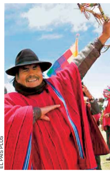
EL PAÍS PLUS