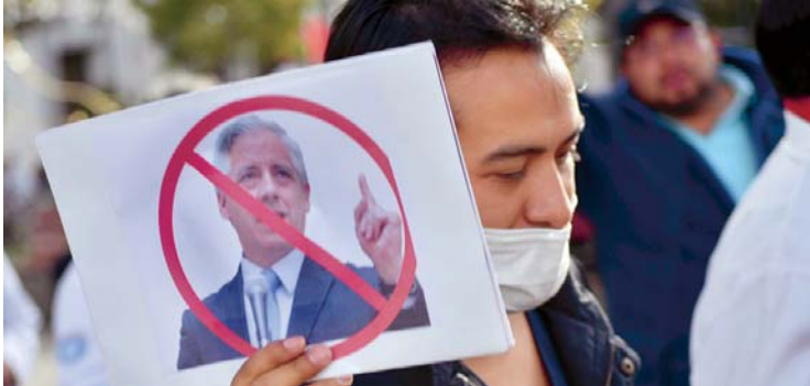
MARCHA DE MANDILES BLANCOS EN LA PAZ