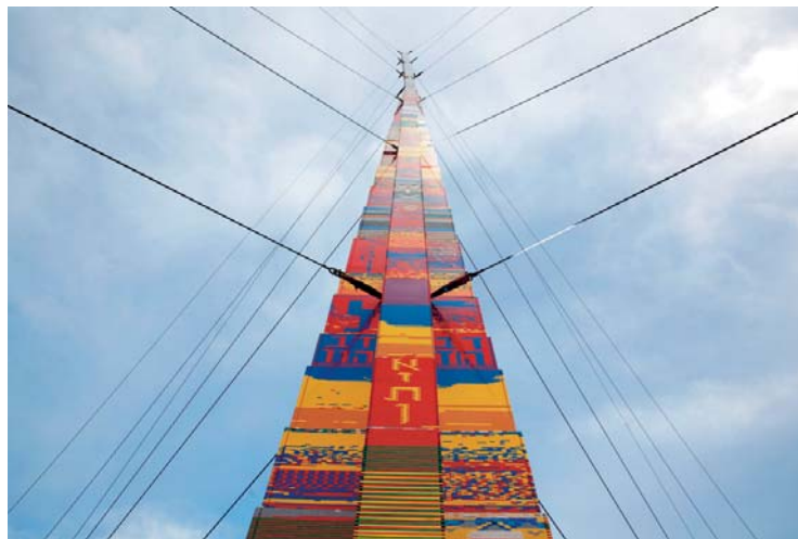
Tel Aviv intenta batir el Guinness con torre de Lego

EL AYUNTAMIENTO DE TEL AVIV TRATA DE BATIR EL RÉCORD GUINNESS DE LA TORRE DE LEGO MÁS ALTA DEL MUNDO CON UNA CONSTRUCCIÓN DE 36 METROS DE ALTURA DESVELADA AYER Y PARA LA QUE SE HAN UTILIZADO MÁS DE MEDIO MILLÓN DE LADRILLOS DE LA CONOCIDA MARCA DE JUGUETES. (EFE)