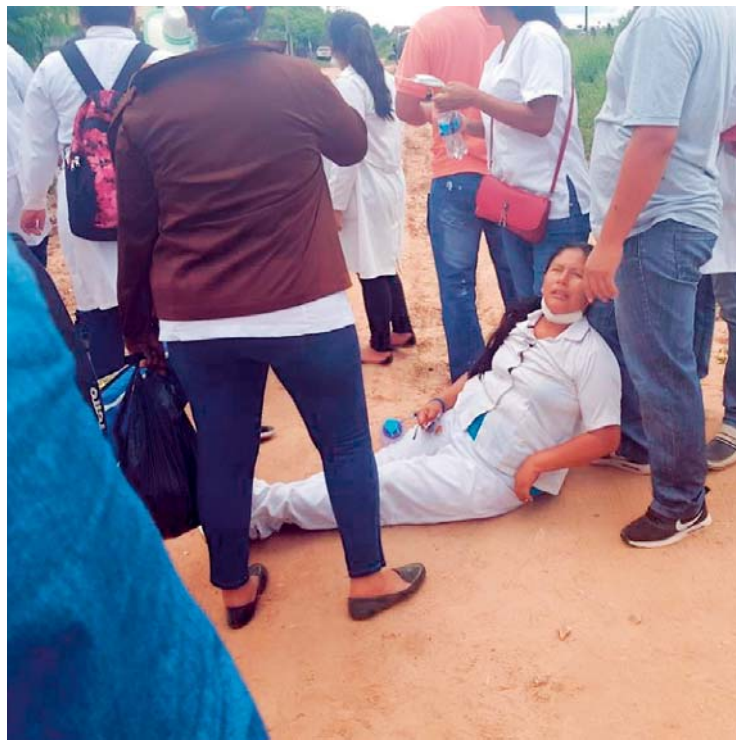
ESTUDIANTE QUE ES ATENDIDA DESPUÉS DE LA GASIFICACIÓN POLICIAL.

Protestas continúan y violencia se trasladó a Santa Cruz