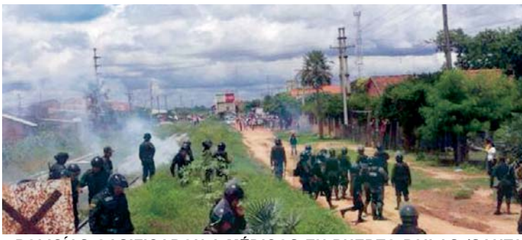
POLICÍAS GASIFICARON A MÉDICOS EN PUERTO PAILAS (SANTA CRUZ)