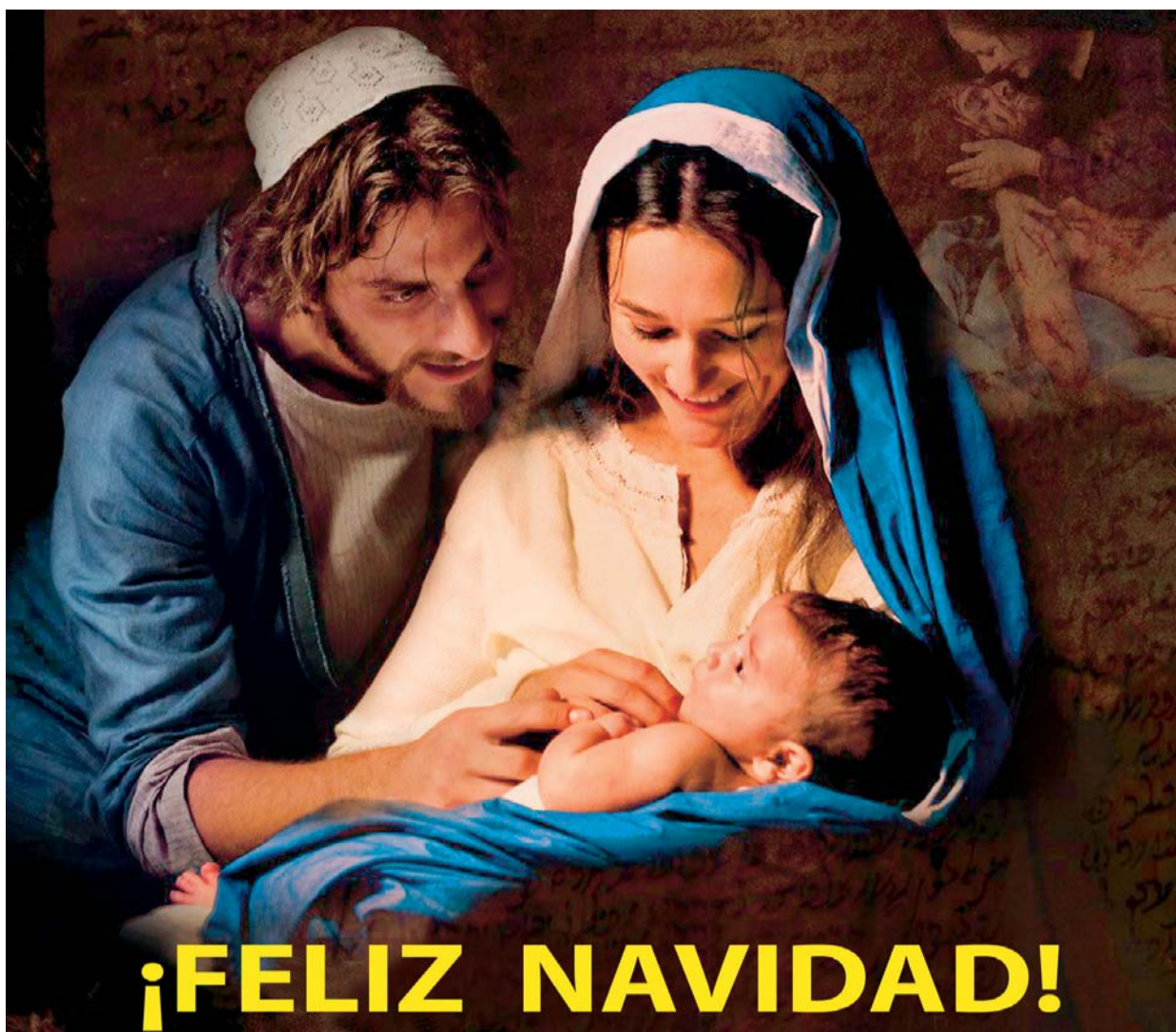
COMO LA ESTRELLA DE BELÉN, LA NAVIDAD DEBE SEÑALARNOS EL CAMINO Y NUTRIRNOS DE ESPERANZA. "DIOS BENDIGA LOS HOGARES BOLIVIANOS", ES EL DESEO DE EL DIARIO.