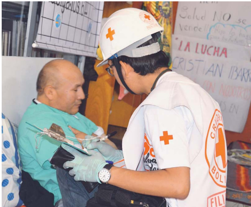
LOS MÉDICOS MANTIENEN HUELGA DE HAMBRE DESDE HACE DIEZ DÍAS.