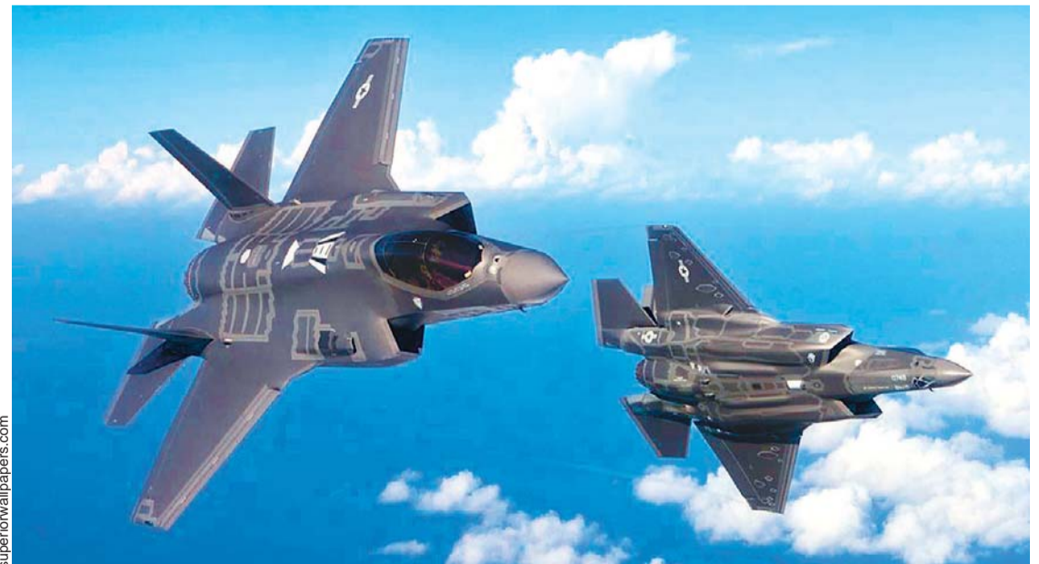
DURANTE LAS MANIOBRAS, LOS ALIADOS SIMULARÁN ATAQUES SOBRE FALSAS INSTALACIONES NUCLEARES SURCOREANAS Y PLATAFORMAS AUTOPROPULSADAS.

Seúl.- Corea del Sur y Estados Unidos iniciaron maniobras aéreas a gran escala que suponen una nueva exhibición de fuerza ante Corea del Norte después de que el régimen de Kim Jong-un lanzara la pasada semana un nuevo misil intercontinental.