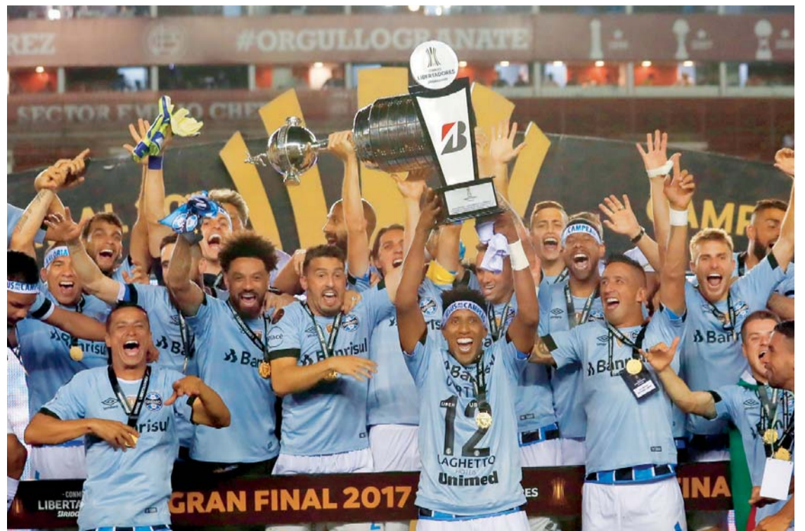
JUGADORES DE GREMIO DE BRASIL CELEBRAN CON EL TROFEO TRAS GANAR LA COPA LIBERTADORES EN LA FINAL ANTE LANÚS DE ARGENTINA, EN EL ESTADIO "CIUDAD DE LANÚS" EN BUENOS AIRES (ARGENTINA).

Gremio de Brasil vivió una noche gloriosa en el estadio La Fortaleza del argentino Lanús, luego de haber derrotado por 2-1 y conquistar por tercera vez la Copa Libertadores, ante la presencia de 45.000 aficionados al sur de Buenos Aires.