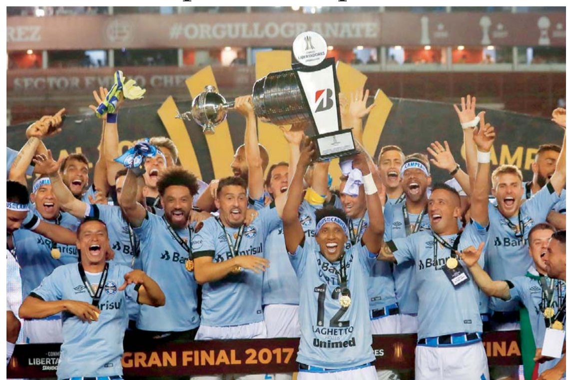
JUGADORES DE GREMIO DE BRASIL CELEBRAN CON EL TROFEO TRAS GANAR LA COPA LIBERTADORES EN LA FINAL ANTE LANÚS DE ARGENTINA, EN EL ESTADIO "CIUDAD DE LANÚS" EN BUENOS AIRES (ARGENTINA).

Gremio de Brasil vivió una noche gloriosa en el estadio La Fortaleza del argentino Lanús, luego de haber derrotado por 2-1 y conquistar por tercera vez la Copa Libertadores, ante la presencia de 45.000 aficionados al sur de Buenos Aires.